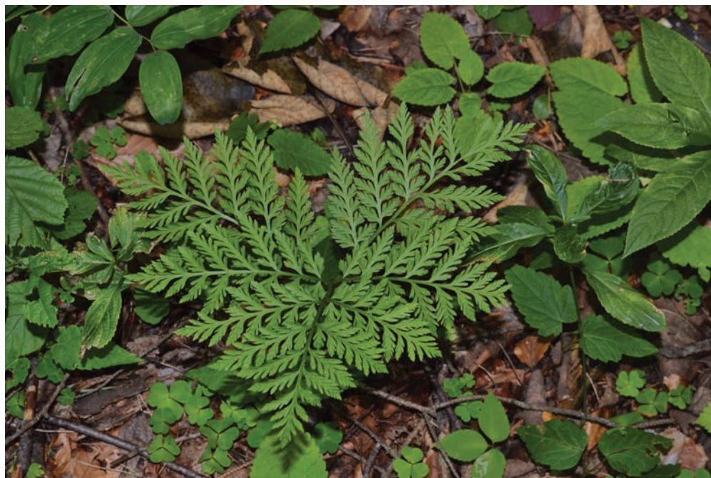
Figure 4 (Slika 4): Botrychium virgi- nianum , Boscoverde/ Zeleni gozd, Tarviso/ Trbiž.