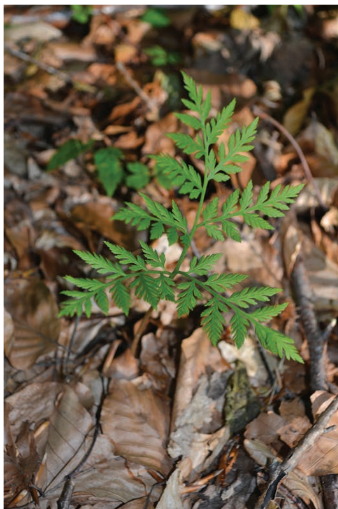
Figure 5 (Slika 5): Botrychium virginianum , Gorjanci, Rute above Orehovce (Rute nad Orehovcem).