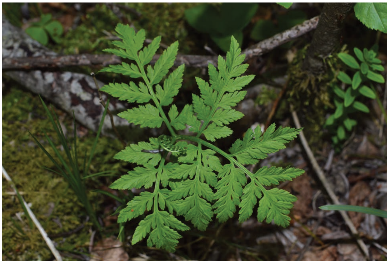
Figure 3 (Slika 3): Botrychium virginianum , Možnica, Log pod Mangartom.