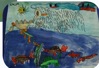
Zala Kereži, 5 let