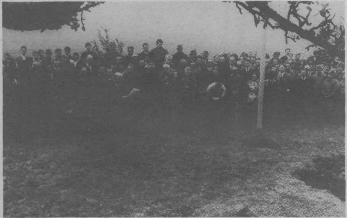
Ena od mnogih spominskih slovesnosti ob spomeniku padlim borcem II. grupe odredov na Tujem grmu.

vžgali po sovražnikih in mednje sejali smrt. Bataljon je to pot doživljal svoj ognjeni krst. Nič preplaha. Nekateri borci je obhajala celo grozljiva radovednost. Le prej,