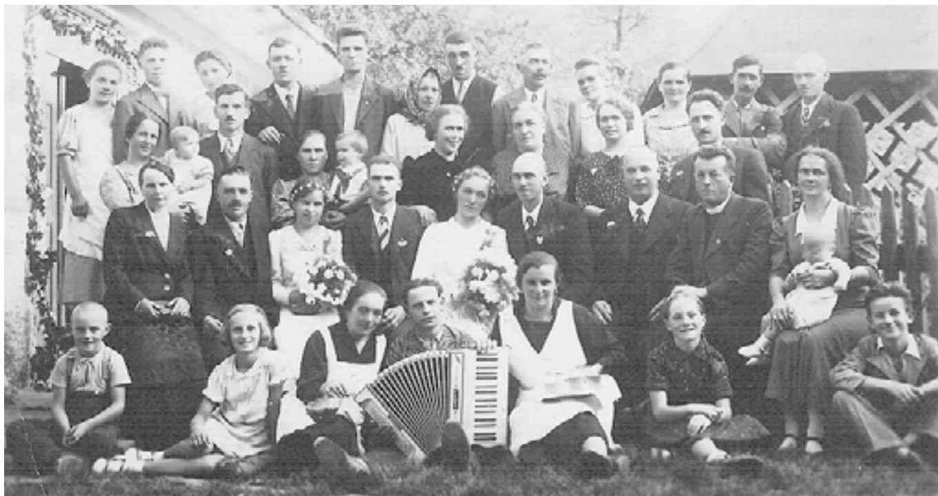
Posebnost njegovega igranja je bilo igranje z levo roko na klavirsko harmoniko.

M inilo je sto let od rojstva mojega strica, maminega brata, po domače Ošanskega Francija iz Šentjanža nad Štorami. Izučil se je za kolarja, vendar tega poklica ni opravljal, ker je bil obdarjen z glasbo. Izvrstno je