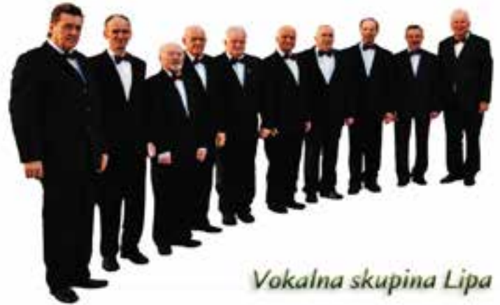
Vokalna skupina Lipa