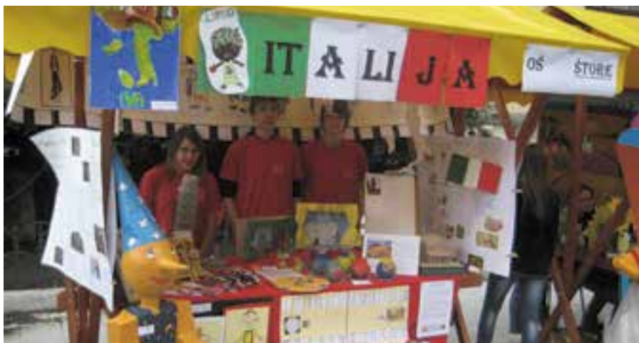
Stojnica na zaključni prireditvi v Celju

Tudi letos je projekt uspešno zaključen, kar pa bi brez dobrega tima in organiziranosti