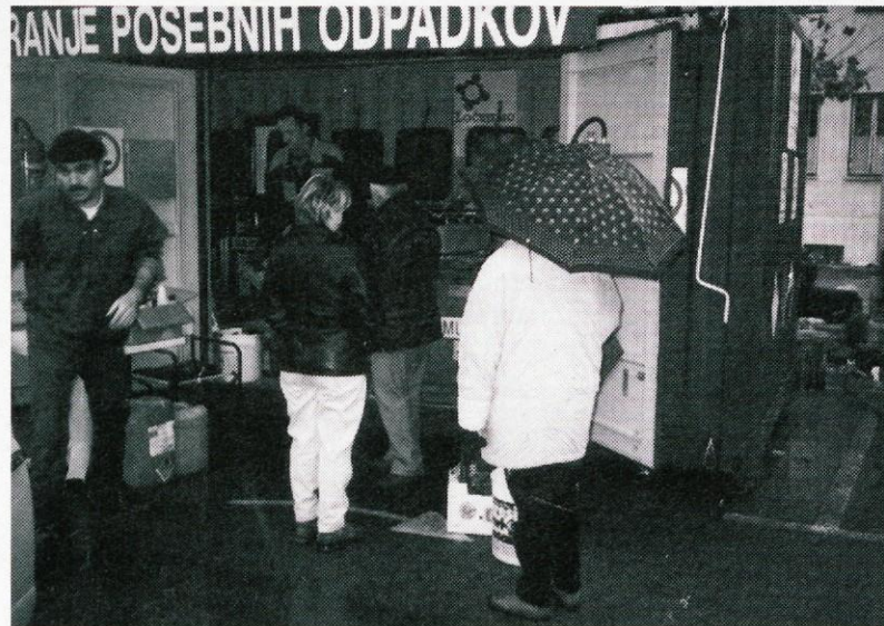
Kontejnersko zbiranje posebnih odpadkov