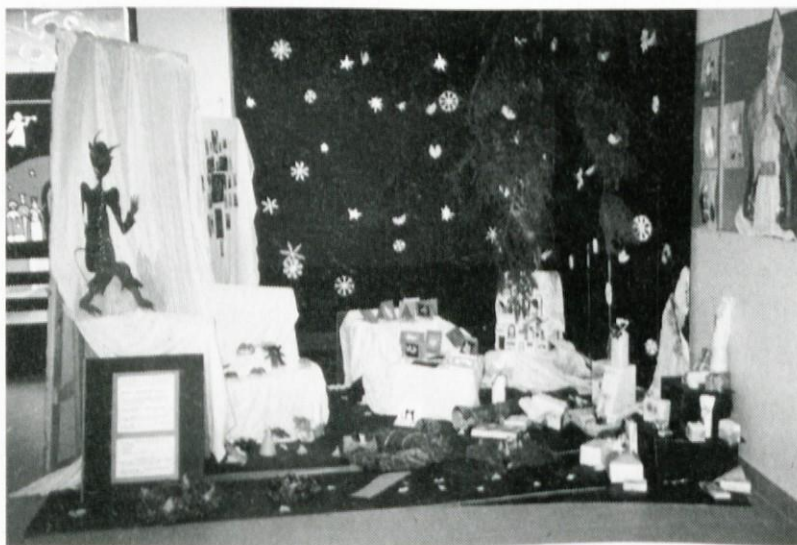
Za UNICEF