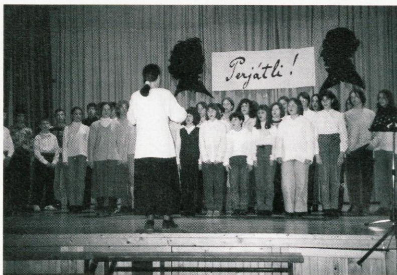
S praznovanja Prešernovega dne v Rovtah