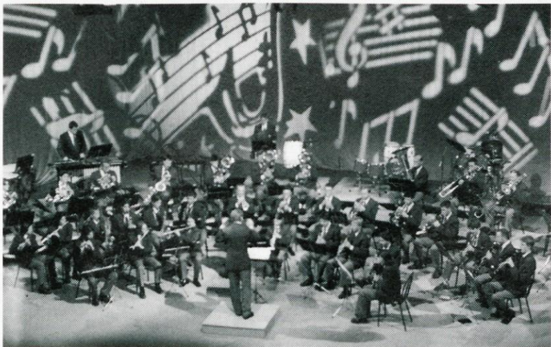
Logaški pihalni orkester med TV snemanjem