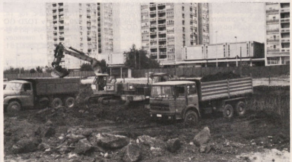
Pri izkopu gradbene jame ima vodilno vlogo strojni park TOZD Mehanizacija.