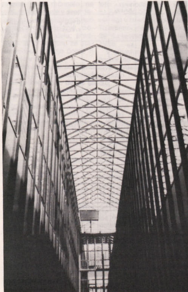
Na razstavi je Vili Šuster sodeloval s fotografijo