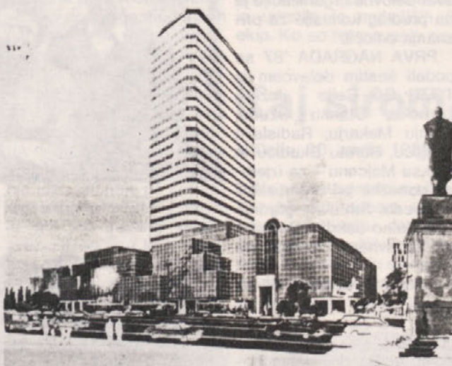
Tak bo objekt na trgu Djerdjinski v Varšavi

Predstavniki Generaleksporta in Gipossa so zadnje dni aprila zaključili dogovore ter s poljskim investitorjem Wadeco podpisali pogodbo za dovršitev in dograditev poslovne stavbe v Varšavi.