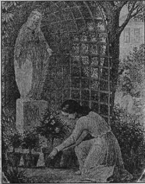
"Tvoj sem, o Mati".

Prav ta in taka vera je pa oni vogelni kamen, na katerega je sezidan sv. rož-