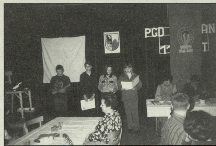
Mladi planinci iz OŠ Bibe Roeka