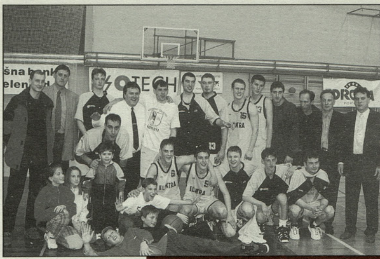
Veselite se zmagi