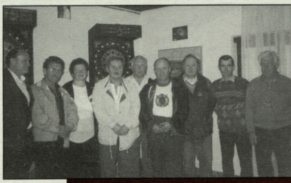
Člani prvih treh ekip v pikadu