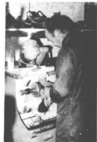
Nama Velenje: Opravljamo samo manjša popravila

daljnjega ne sprejemam v popravilo starih čevljev. Tukaj že ne bo nič smo pomislili. „No tako hudo že ni,“ nam je zagotovil lastnik delavnice. „Včasih že še vzamem kakšne čevlje v popravilo, kajti nerad vidim, da gre stranka nezadovoljna iz moje delavnice. Sprašujete kje so vzroki? V zadnjem času se ukvarjam samo z ortopedijo, ki je mnogo bolj donosna. Le tako lahko namreč plačujem vse obveznosti in dajatve. S samim krpanjem in šivanjem čevljev pa tega ne bi zmozel. Kot sami vidite, imam samo enega zaposlenega. Imel sem sicer že dva, pa se je eden poročil in se odselil v Mur-