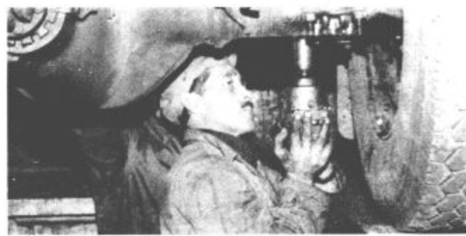
Vozila je treba nenehno vzdrževati