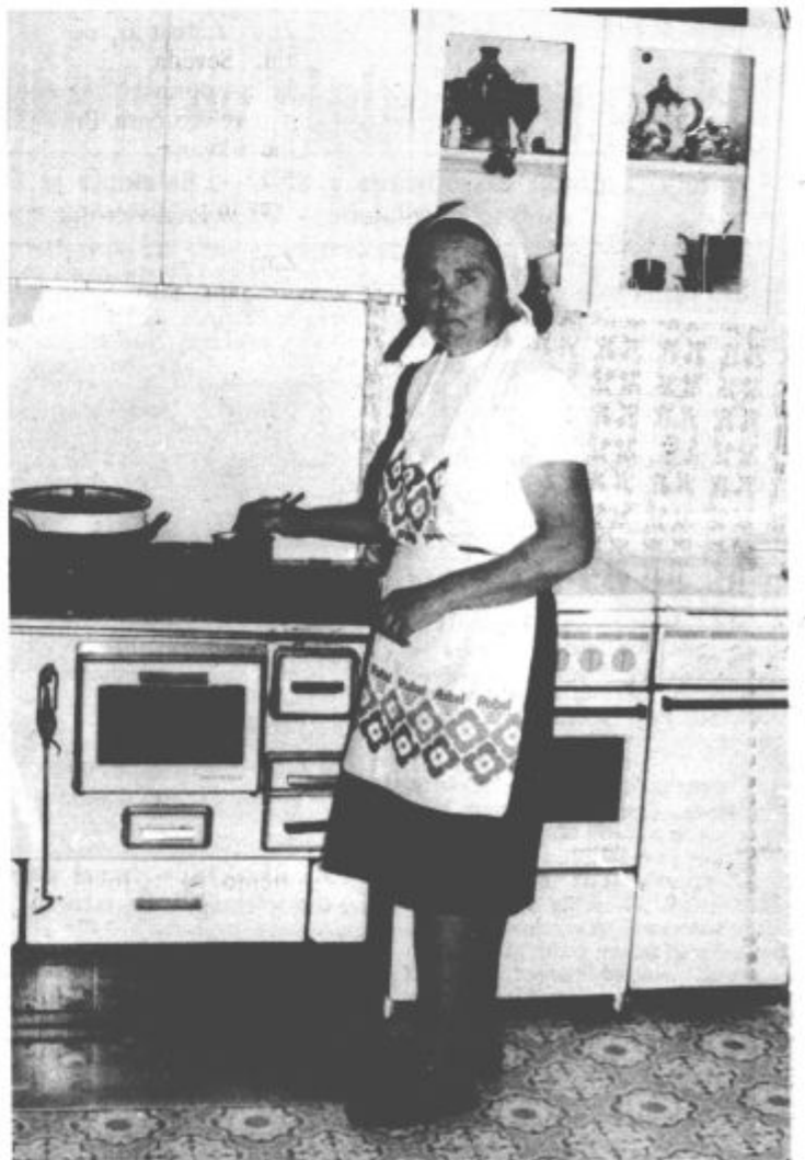
Začeli smo skoraj iz nič