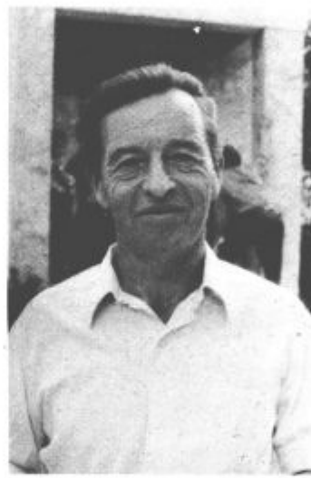
Včasih življenje tu ni bilo tako lepo