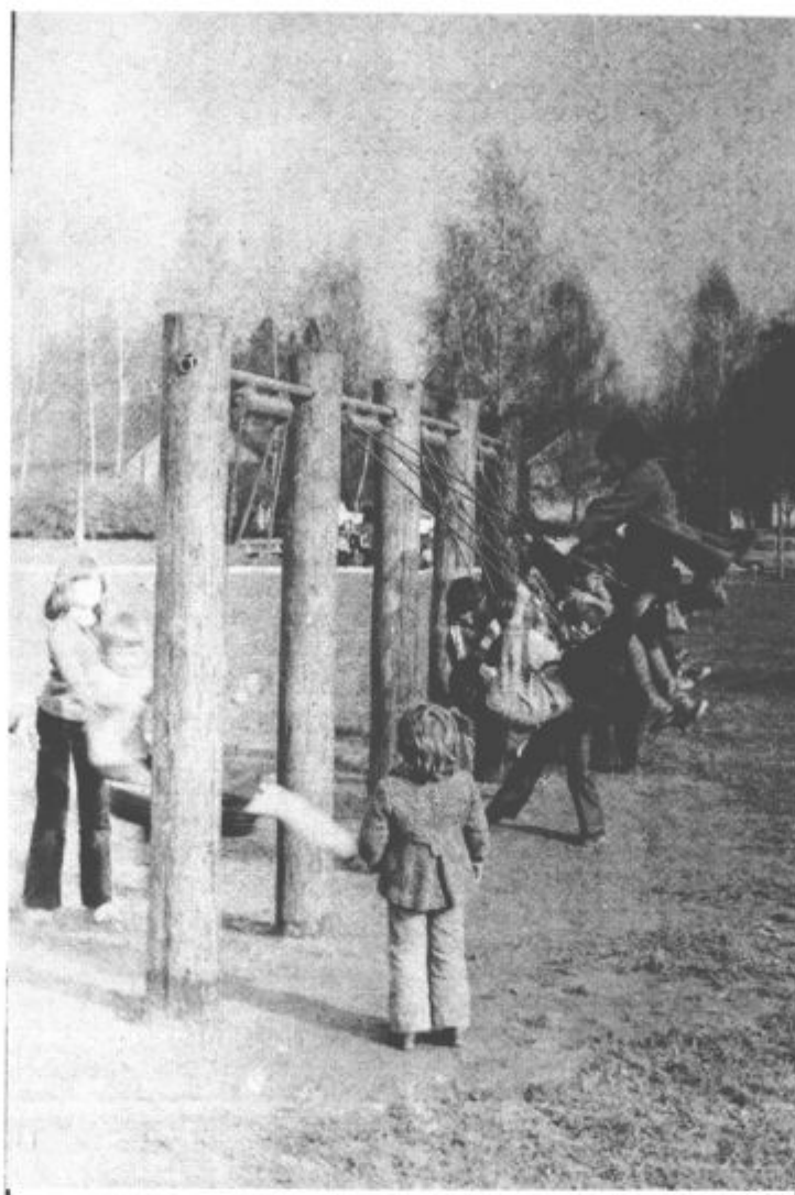
Danes so se po dobrih dveh mesecih znova odprla šolska vrata. Konec je brezskrbnih počitnic in pred učenci je ena sama želja, kako si pridobiti kar največ znanja v novem šolskem letu. Za cicibančke, ki bodo letos sedli v šolske klopi pa je seveda današnji dan izjemen dogodek. Vsem želimo, da bi bili v novem šolskem letu kar najbolj uspešni.

Teško bi našli kakšno večjo prireditve v Velenju, ki bi minila brez nastopa članov Šaleške folklorne skupine. Z uspehom pa predstavljajo našo folkloro tudi izven naših meja. Tako so gostovali v Italiji, Franciji, Španiji, Belgiji in na Poljskem, povsod pa so naredili dober vtis, kar dokazujejo nova povabila za gostovanja.