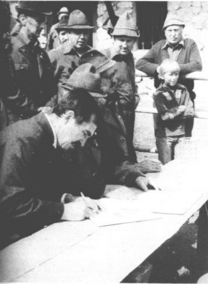
Podpis listine o pobratenu z lovci iz Rogatca