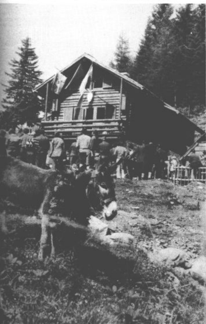
Material za novo kočo so morali znositi. Pomembno vlogo pri tem imeli tudi osli.