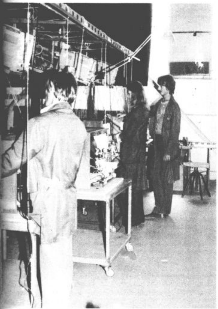
Na Ptujju bodo gradili nove prostore za proizvodnjo črno-belih televizijskih sprejemnikov.

V jubilejnim letu, ob 25-letnici, se družina Gorenje znova povečuje. Nedavno tega se je v sestavljeno organizacijo združenega dela Gorenje vključilo elektrostrojno podjetje TIKI Ljubljana, sredi meseca septembra pa bodo ob tem odločali delavci Lesne industrije Nazarje.