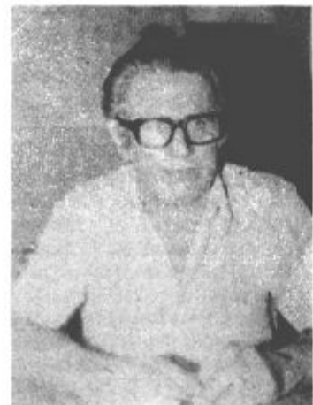
Težko dobimo kvalificirano delovno silo

38 delavcev zaposlenih pri DES TOZD Elektro Slovenj Gradec, enota Velenje, noč in dan skrbi za to, da ima velenjska občina nemoteno preskrbo z električno energijo. Verjetno se nanje niti ne spomnimo, kvečjemu 15. v mesecu, ko pridejo kasirati tokovino, ali pa kadar zmanjka elektrike. Pa še takrat si mislimo o njih vse prej kot kaj lepega. Ne zanima nas kje delajo, v kakšnih pogojih in kako delajo. Od njih zahtevamo samo eno: nemoteno preskrbo z električno energijo. Mi pa smo jih pred kratkim obiskali in radi so spregovorili o svojem delu.