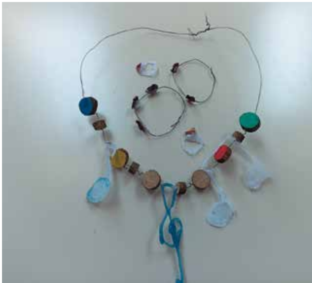
Slika 2: Glasbena verižica.

Na fotografijah je predstavljenih nekaj izdelkov, pri katerih se vidi ustvarjalnost in vizija. Učenci so svoje delo podkrepili tudi z zapisi in ustnimi pojasnili.