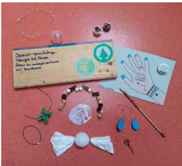
Slika 3: 3000 let.

Pia je delala sama od začetka do konca. Večino načrta je imela v glavi, delala je hitro, natančno in učinkovito. Po srcu je glasbenica, zato tudi takšni izdelki. Izbrala je