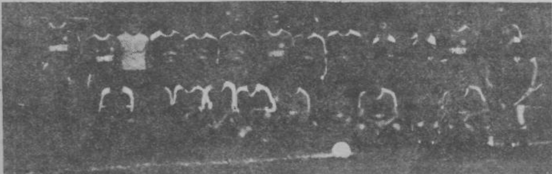
Skupni posnetek nogometašev Olimpije in Livarja.