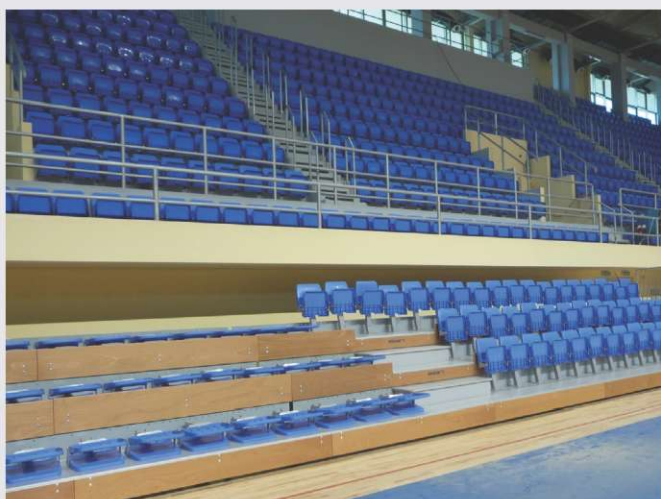
Športna dvorana Smederevo

V juliju je bila otvoritev tudi dvorane v Rogatcu. Dvorana parterja je v velikosti rokometnega igrišča, na galeriji pa je manjša dvorana, namenjena aerobiki, plesu in prireditvam.