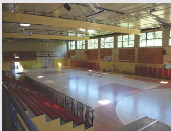
Športna dvorana Rogatec