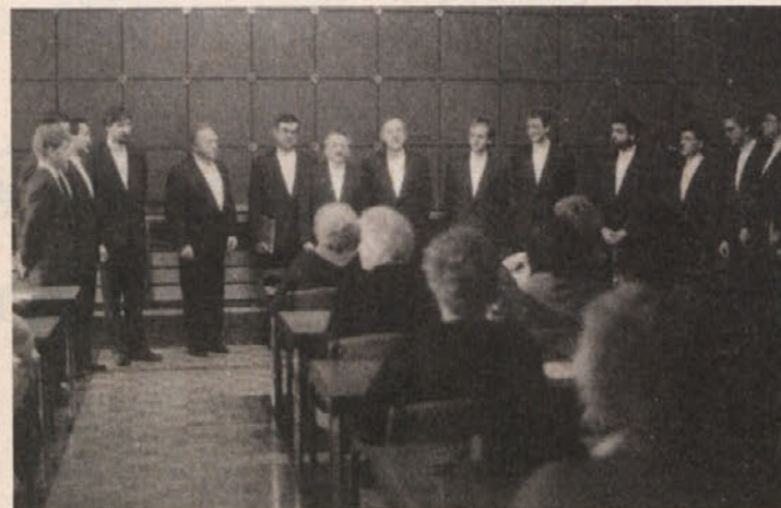
Moški zbor SPD „Trta“ je zapel Zvezi slovenskih žena

Stanovanjsko gradbena dejavnost se bo morala koncentrirati na področja, ki so že urbanizirana, da bi se ognili prevelikemu razseljevanju. Turizem, od katerega živi precejšen del prebivalstva, bo moral gledati bolj na kvaliteto kot na številčno povečanje gostov. Velik problem je promet; tega nameravajo nekoliko preurediti in poskrbeti za primerne poti za pešce in kolesarje. Precej sil pa bodo vložili tudi v učinkovito in sodobno odstranjevanje odplak in odpadkov.