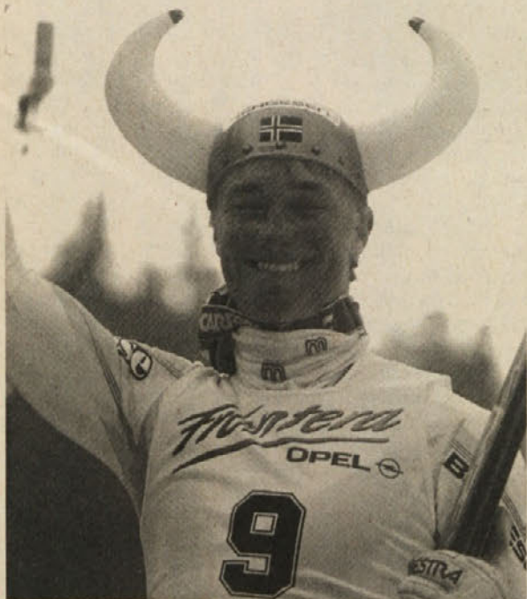
Kjetil Andre Aamodt, najuspešnejši smučar letošnjega svetovnega prvenstva