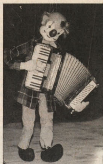
Pirhlnov hatej so bili veseljak

nih praznovali stoti rojstni dan. Župan bi prišel k njemu in v časopisih bi bil. Pa ni pomagalo. Vendar niso umrli zanalašč, kot to pravi njegova tretja žena. (Prvi dve sta mu umrli zaradi notranjih poškodb – tretja je bila močnejša od njega).