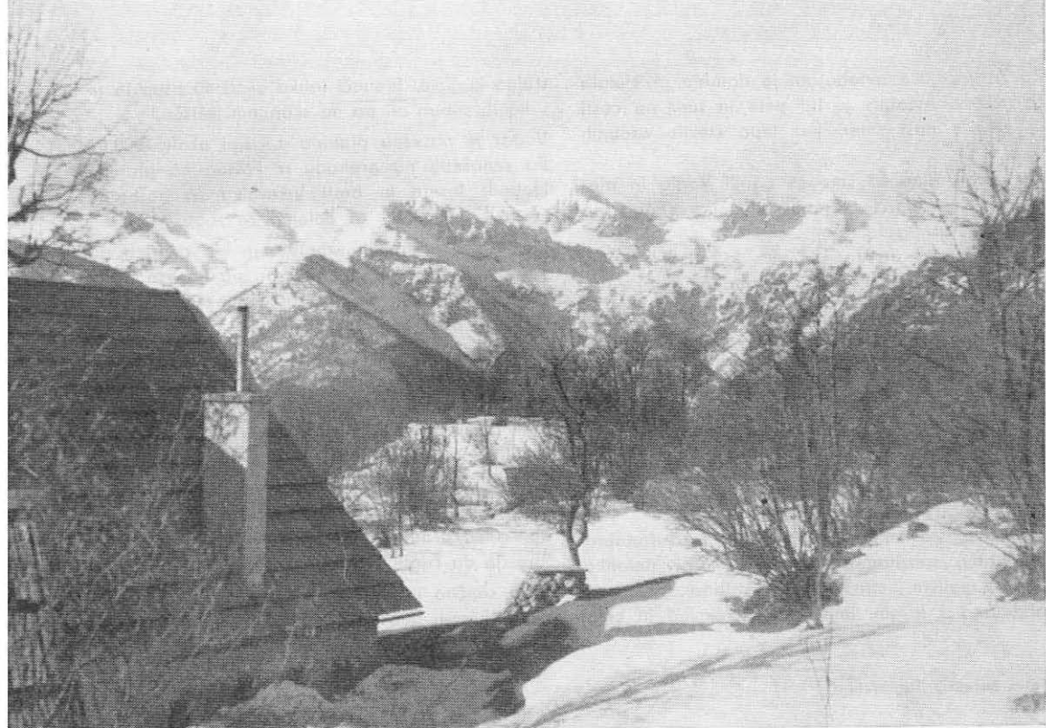
Bohinjske gore z Vogarja