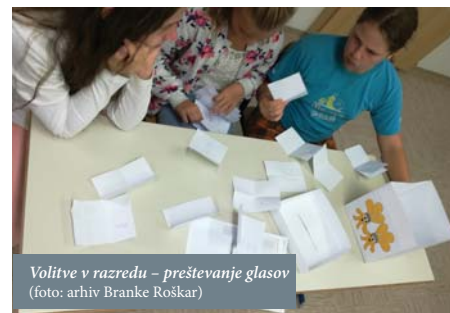
Volitve v razredu – preštevanje glasov

Podelila se je tudi posebna nagrada za izvirnost. Najboljše smo razglasili na proslavi ob kulturnem prazniku, nagrajene izdelke smo tudi razstavili. Cilj te dejavnosti je bil izpostaviti himno kot narodni simbol ter hkrati utrjevati pomen lepopisa med mladimi.