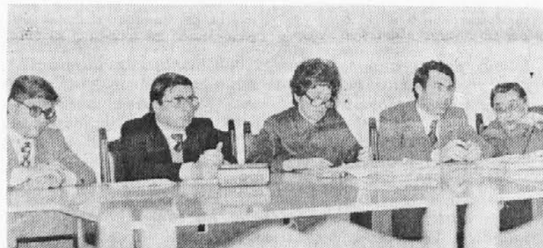
Predstavniki strank in organizacij, ki so govorili o problemih zaštite Slovencev