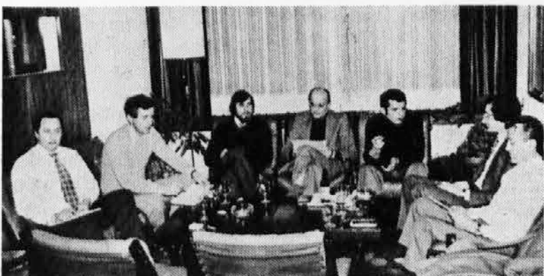
Una riunione di lavoro del gruppo ristretto che ha coordinato gli interventi dell'Unione al Convegno

Esempio: Tizio, emigrato in Belgio non è proprietario di alcuna abitazione e vuole rientrare nel suo paese di origine. Avrà diritto ad un contributo una tantum pari al 65% di quello spettante in relazione al numero dei componenti il suo nucleo familiare.