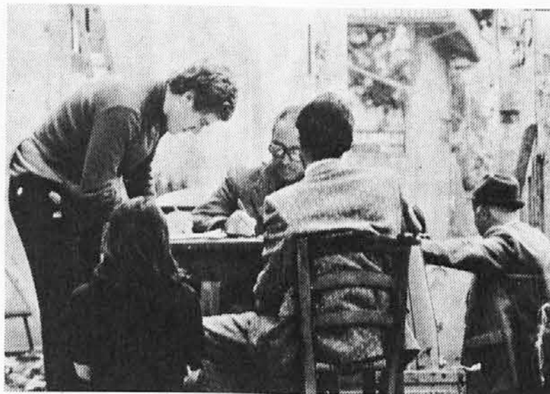
Ažla: tako je komun delau po potresu

Načelnik svetovalske skupine KPI Battocletti je predlagal, da bi izdelali prednostno lestvico potreb v posameznih občinah.