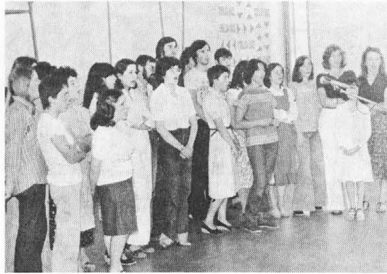
Moja vas 1977. poje zbor «Pod lipo»