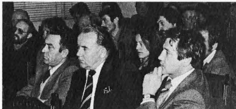
Tolminska delegacija in del občinstva, ki se je udeležilo okrogle mize v Cedadu