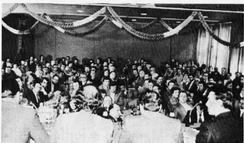
Una parte del numeroso pubblico convenuto a Basilea da tutta Europa