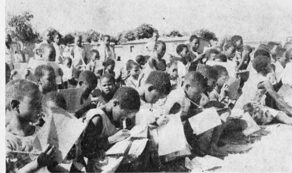
Sola na prostem na slovenski misijonski postaji Matero v Zambiji. V to šolo hodijo otroci, ki niso bili sprejeti zaradi pomanjkanja prostora v zidane šolske prostore. Samo v Matero obiskuje šolo na prostem 1300 otrok.