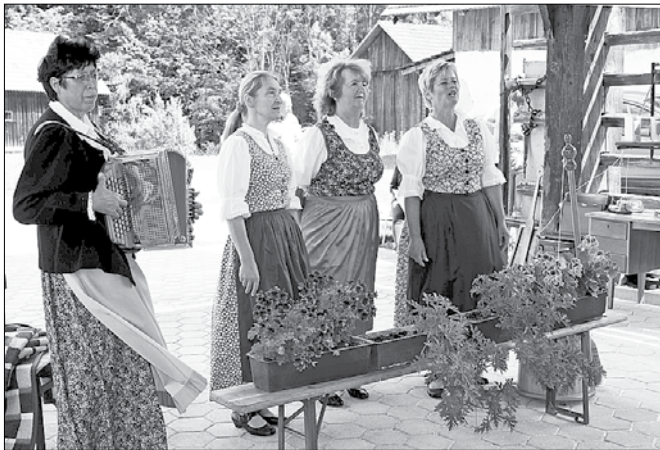
Pušeljci zdaj nastopa kot ženski kvartet ljudskih pevk.