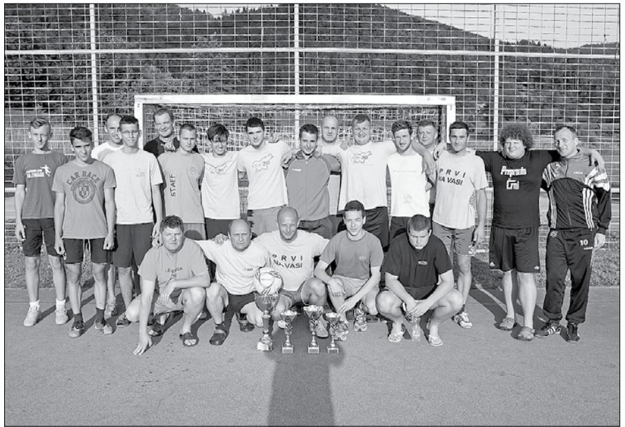
Udeleženci malonogometnega turnirja v Nazarjah