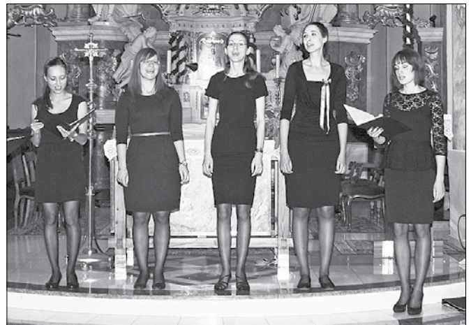
Dekleta ženskega pevskega zbora Mens sonora so navdušile s sakralnimi napevi, liturgičnim besedilom, madrigali in ljudsko pesmijo.

Sodelovale so z velikim številom priznanih slovenskih zborov in go- stovale v različnih krajih Slovenije. La- ni so se dekleta predstavile tudi na mednarodnem pevskem festivalu v avstrijskem Bad Ischlu in kot najbolj- ši ženski zbor tekmovanja domov pri- šle z dvema zlatima plaketama. Nji-