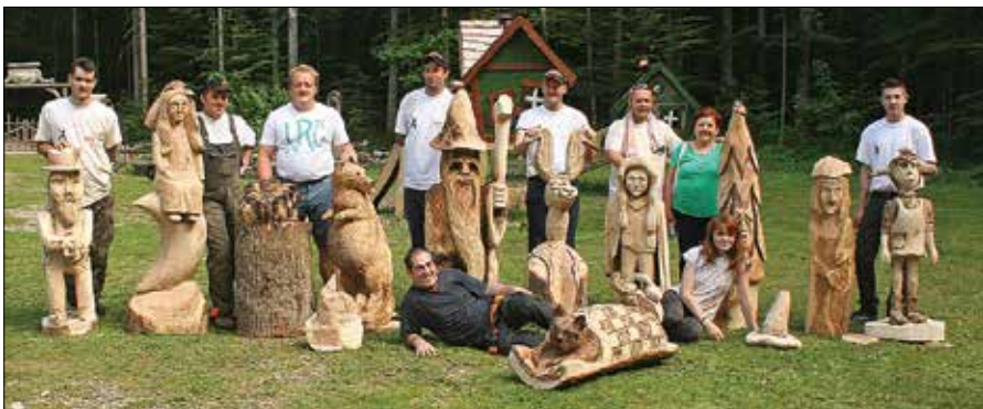
Člani Društva kiparjev z motorno žago so v Logarski dolini ustvarjali živali in pravljična bitja.