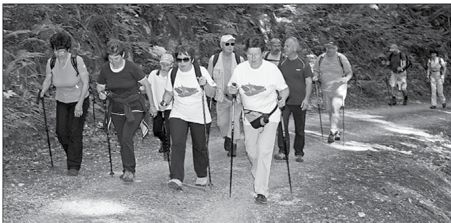
Pohodniki so se na Čreto podali s Farbance po vlakci in obiskali nekatere spomenike padlim partizanom.

O dogodkih tedanjega časa in v spomin padlima partizanoma je spregovoril predsednik Združenja borcev za vrednote NOB Mozirje Jo-