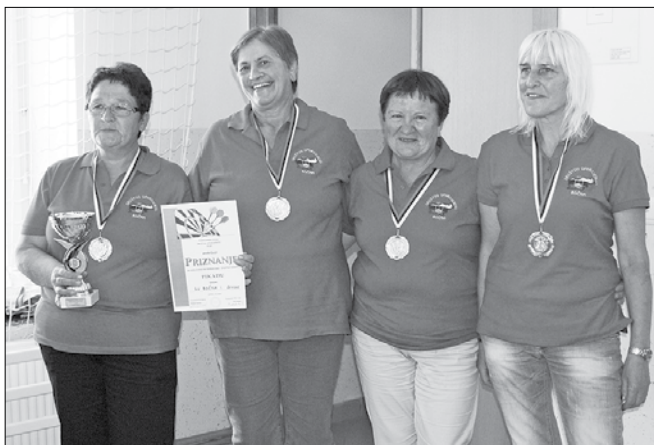
Zmagovalna ženska ekipa iz Bočne, ki se je uvrstila na državno tekmovanje.

Bočki upokojenci so organizirali pokrajinsko prvenstvo v pikadu, ki se ga je udeležilo 15 ekip, sedem ženskih in osem moških. Med ženskami so bile ponovno nepremagljive članice bočke ekipe, ki so se uvrstile na državno tekmovanje. V ženski konkurenci so jim sledile tekmovalke iz Andraža nad Polzelo in Mozirjanke, peto mesto je osvojila druga bočka ekipa. Pri moških so bili nepremagljivi tekmovalci iz Žalca, sledila jim je ekipa Bočna 1 in Andraž, Bočna 2 je bila diskvalificirana, dosegli pa bi odličen rezultat.