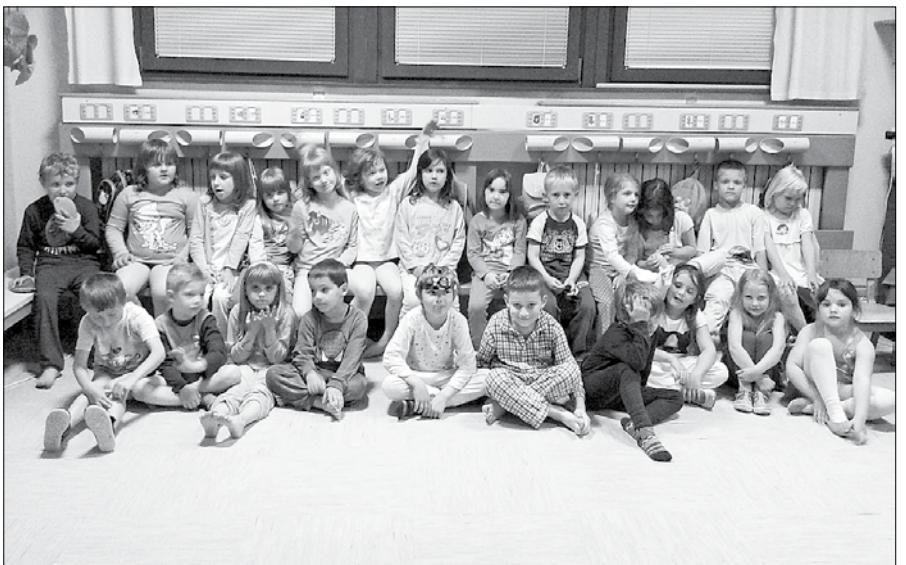
Otroci so eno noč preživeli brez svojih dragih staršev, bratcev, sestric, babic in dedkov.