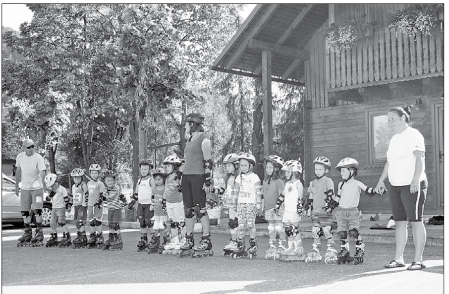
Otroci so ob zaključku tečaja staršem pokazali, kaj so se naučili.