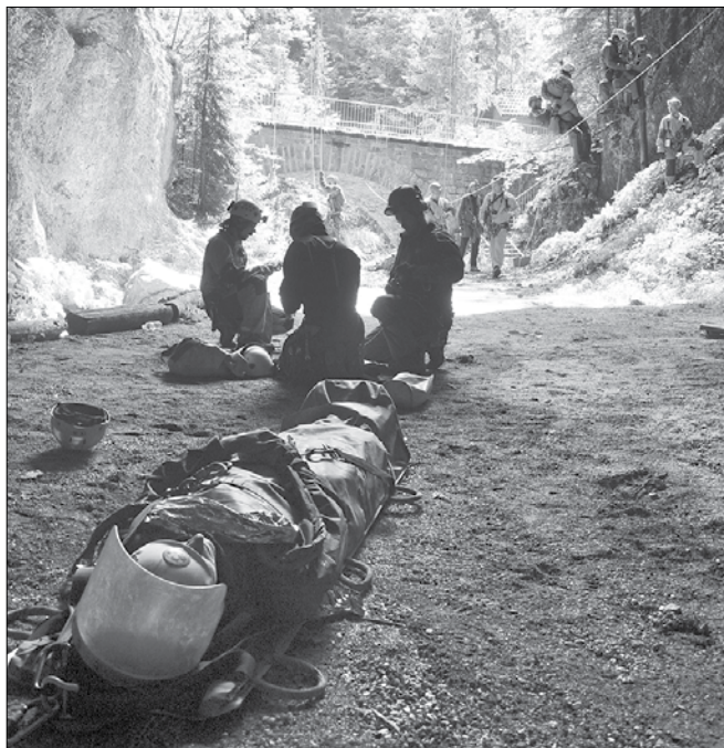
Huda luknja, kjer je potekalo opravljanje izpitov za jamarskega reševalca in pripravnika, velja za največjo jamo na tem koncu Slovenije.

Kolikor večji je bil napor in kolikor težje so bile ovire, toliko večja in