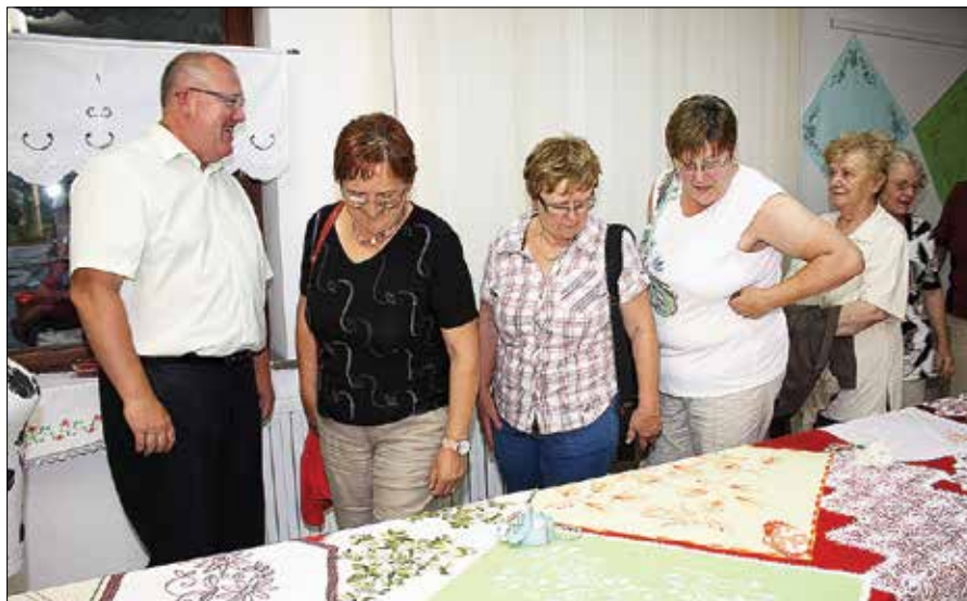
Zanimivi vzorci na vezeninah so pritegnili številne poglede obiskovalcev.