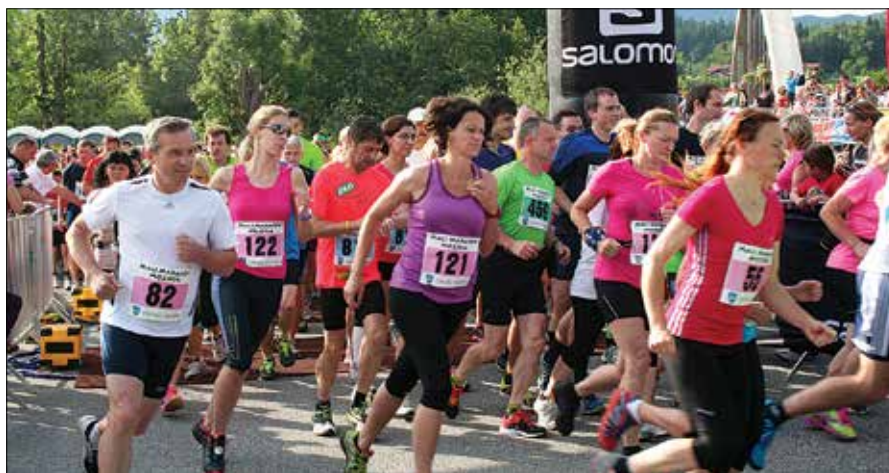
Štart je bil v lepem vremenu, podelitev nagrad pa je zaradi plove potekala v prireditvenem prostoru.