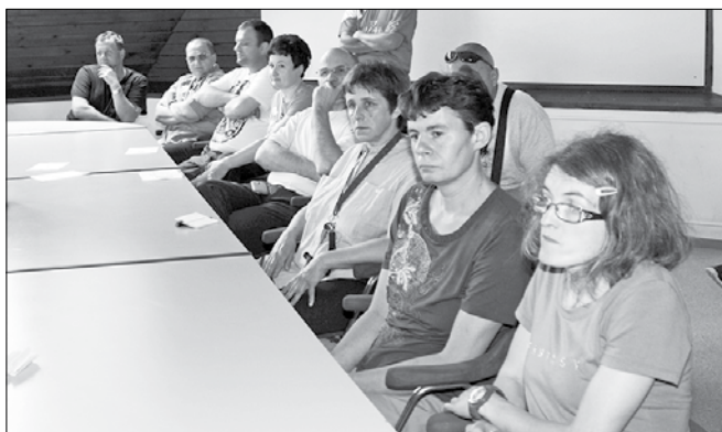
Delavci so prisluhnili predavanju o postopkih pridobivanja enkratne socialne pomoči in o ostalih socialnih transferjih.