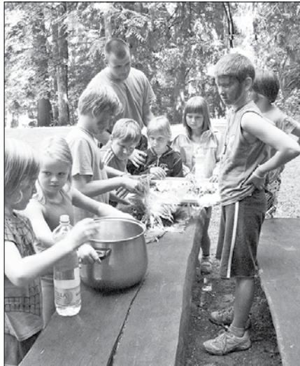
Delavnice, ustvarjalnice in organizirana športna druženja so za otroke med počitnicami zelo dobrodošla.

Na OŠ Ljubno ob Savinji so nam povedali, da se bo veliko njihovih učencev udeležilo planinskega tabora, ki ga bo ljubensko planinsko društvo (PD) izvedlo v začetku julija. Tudi na ta način lahko starši poskrbijo za cenovno relativno ugodno varstvo svojih otrok. Izvedbo planin-