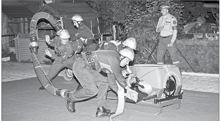
Pod reflektorji se je na Rečici ob Savinji pomerilo 18 članskih ekip prostovoljnih gasilskih društev iz različnih krajev Slovenije.