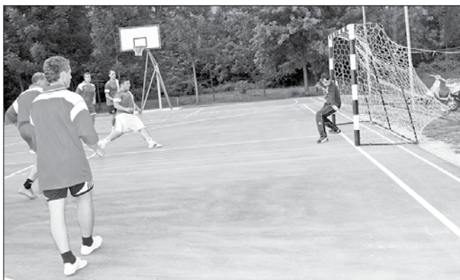
Nogometno druženje gasilcev je bil čas za sproščanje in nabiranje kondicije, ki jo ob intervencijah le-ti še kako rabijo.

Po sistemu vsak z vsakim so gasilci dokazali, da jim tudi druženje ob igri ni tuje. Ob tem so gledalci uživali v številnih dobrih akcijah in zadekih. V finalnem obračunu so se srečale ekipe PGD Gorica ob