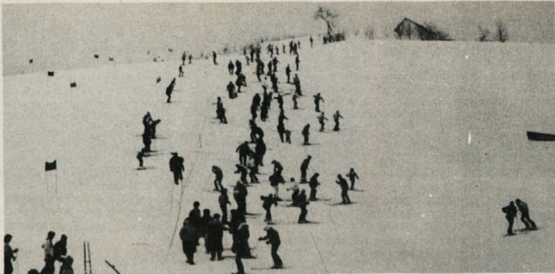
Pogled na smučišče

Petra Cvijanović — 34,84 (Ločna) Mihaela Novak — 39,14 (Commerce)