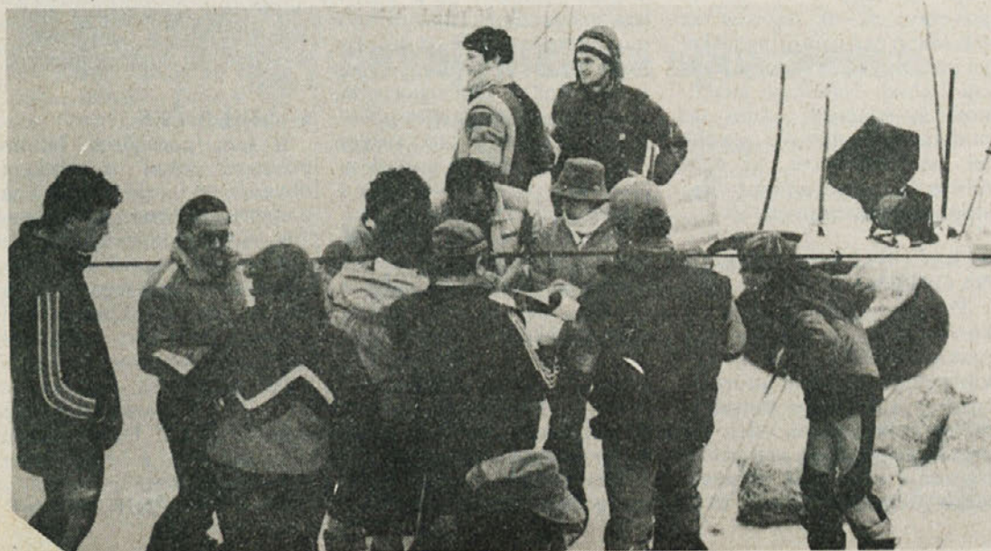
oa ni manjkalo tekmovalnega vzdušja.