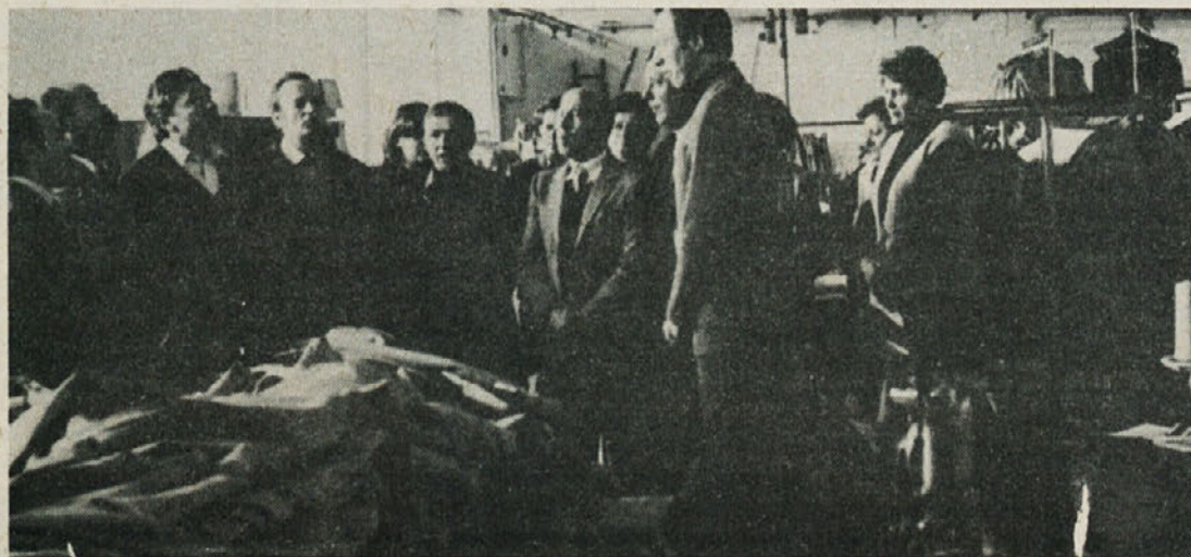
Ob priložnostnih proslavah se v naših proizvodnjah zasliši namesto drdranja strojev recitacija ali ubrana pesem. Posnetek je nastal v Temenici.

Sicer je prevzel tozd Ločna, Commerce in tudi DSSS nekaj pokroviteljstev nad pevskimi zbori ali glasbenimi ansambli. To je en vidik skrbi za širjenje kulture, dodati pa je treba, da kulturni animator v DSSS poskrbi za kvalitetne nastope ob praznikih, predvsem ob 8. marcu. Naša osrednja prireditev je ex-tempore, o katerem smo že veliko povedali in napisali, ki ima odmevnost v celi Sloveniji. Premalo pa je storjenega za bralnost, za bolj kulturne medsebojne odnose, za širjenje zavesti o nujnosti kulture med nami na vsakem koraku. To pa je stvar vzgoje, torej stvar časa. Le dovolj vztrajni in potrpežljivi bodo gradili to nevidno, pa vendar nujno pot razvoja, ki človeka obogati in oplemeniti.