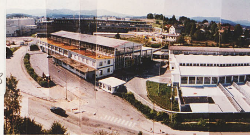
Pogled na Karlovško cesto in upravno stavbo IMV nekdanj