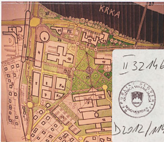
Študija bolnišničnega kompleksa, 2004