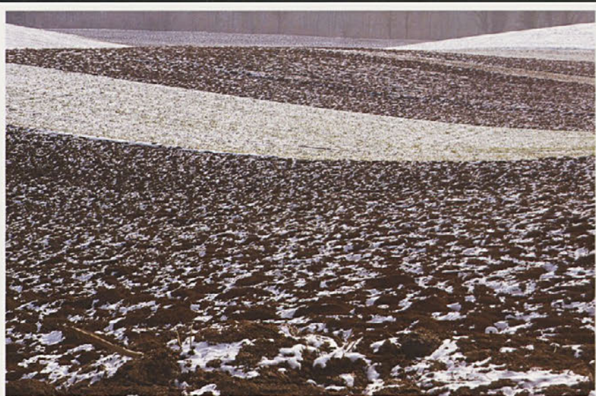
Njive v snegu, Otočec