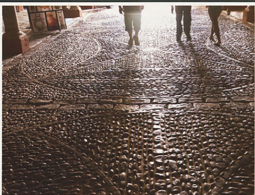
Ulica v Cordobi, Španija 2010