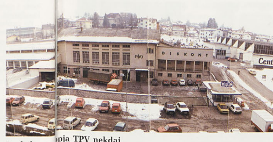
Pogled na prodajni salon TPV nekdanj