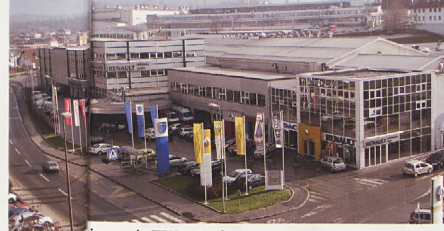
Prodajni salon TPV avto danes