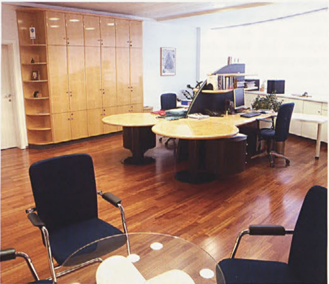
Notranja oprema pisarn v TPV

Nadaljevanje s 1. str. mladi po slavnih dogodkih v preteklosti. V smislu načel prenove in usmerjanja razvoja po trajnostnih načelih dodajamo v sklop nove poslovno-trgovsko-stanovanjske zmogljivosti, ki bodo po eni strani povečale majhno poseljenost v osrednjem delu križišča (novega trga), po drugi strani pa bodo po oblikovni plati pomagale povečati mestotvornost. Nove površine so označene z modro barvo in jih dodajamo tudi ob križišču Smrečnikove s Trdinovo in Resslerovo ulico, kar oblikuje tudi nekakšen nov mestni vhod v središče mesta.