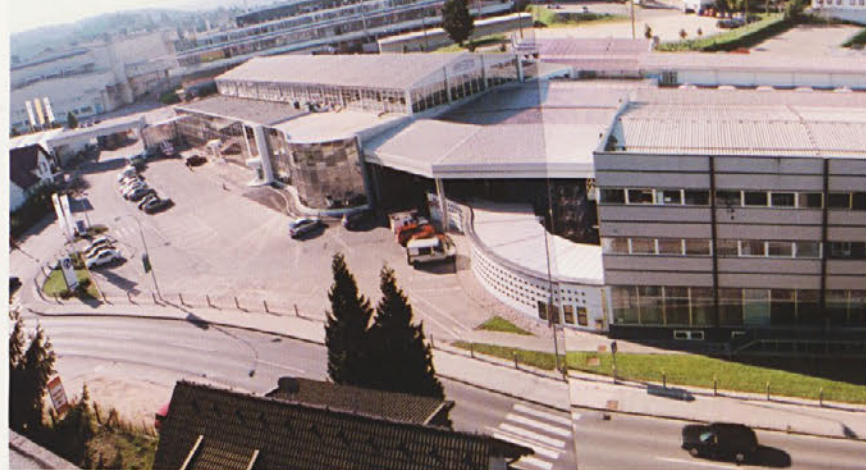
Pogled na upravno stavbo TPV danes