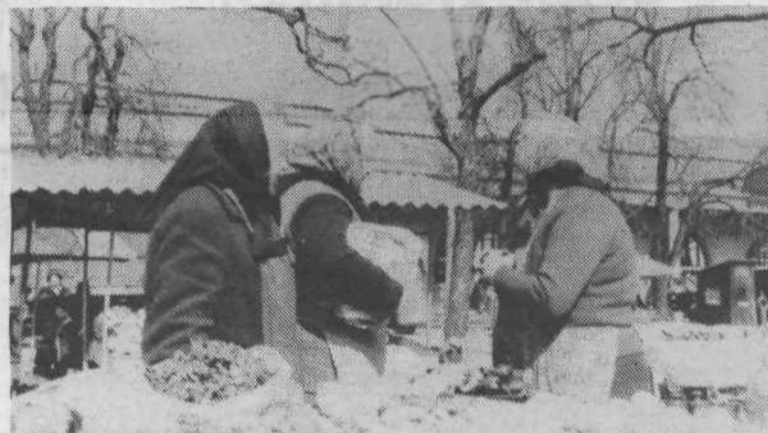
3. O čem je tekel klepet med temi tremi prodajalkami lastnega pridelka na ljubljanski tržnici, lahko le ugibamo. Sicer pa se v teh dneh tako vsi pogovori sučejo okoli cen bencina in povratnem vplivu teh cen na vse ostale dobrine, zlasti prehranske, ki so na tržnih pulitih.