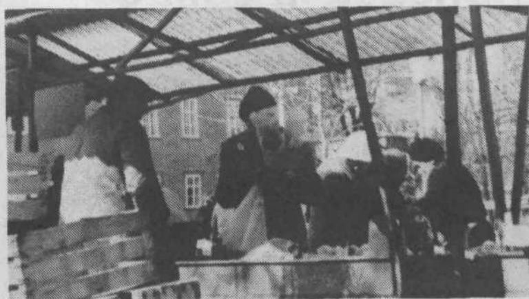
1. Pravzaprav sodi tudi ta slika k 8. marcu. Marsikateri malo bolj praktičen moški je ženi, poleg obveznega šopka, kupil tudi četrt, ali celo pol kilograma radiča. Konec koncev je vsaj del te dragocene dobrine pristal v njegovem želodcu.