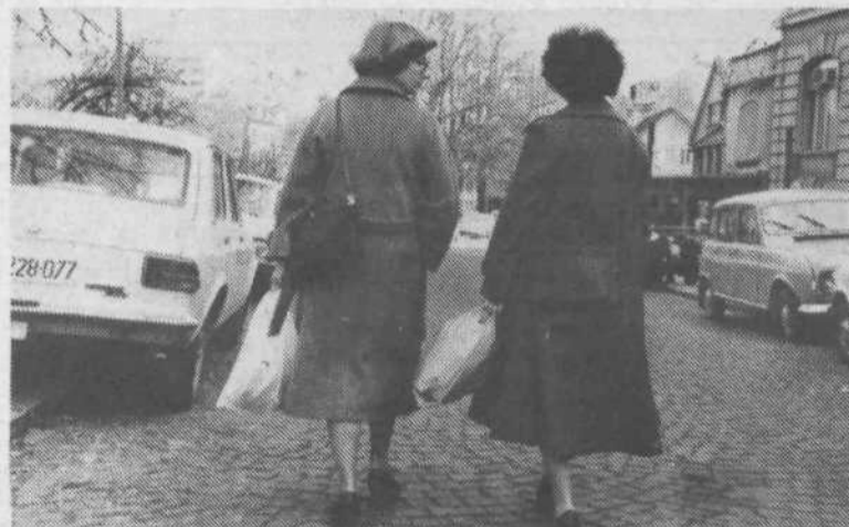
4. Čajne so polne, cesta široka, pogovor prijeten. Res škoda, da nimava kam skočiti še na skodelico kavice, potem pa nazaj v službo.