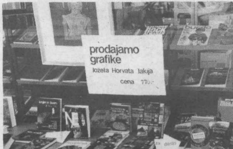
2. V Cankarjevi založbi nasproti trga prodajajo grafike Jožeta Horvata. Za nekaj kg radiča, še manj kg mesa dobite tudi lepo kulturno dobrino.