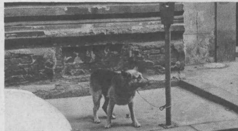
5. Ljubljanske parkirne ure so dobesedno na psul. Poglejte dokaz.