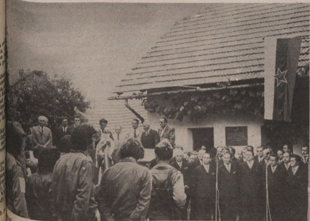
„Ljubljanske“ pred domačijo, kjer je bila pred 30 leti ta brigada ustanovljena.