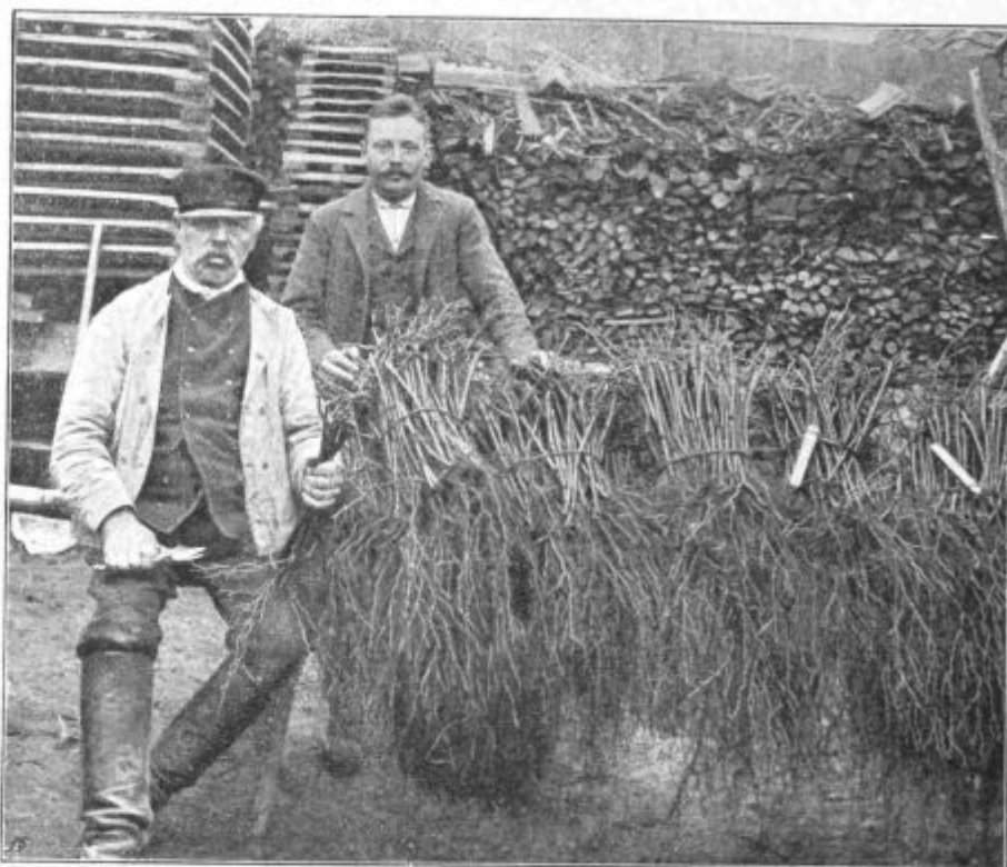
Podoba 49. Tip nižjeavstrijskega kmeta-vinogradnika s sinom. Spredaj so cepljene trte, ki so bile kaljene v hlevu.

Zaraditega bomo pri prebiranju morali posebno skrbno gledati ne to, kako so cepljenke na cepljenem mestu zrasle. Da jih preskusim, primem podlogo v levo,