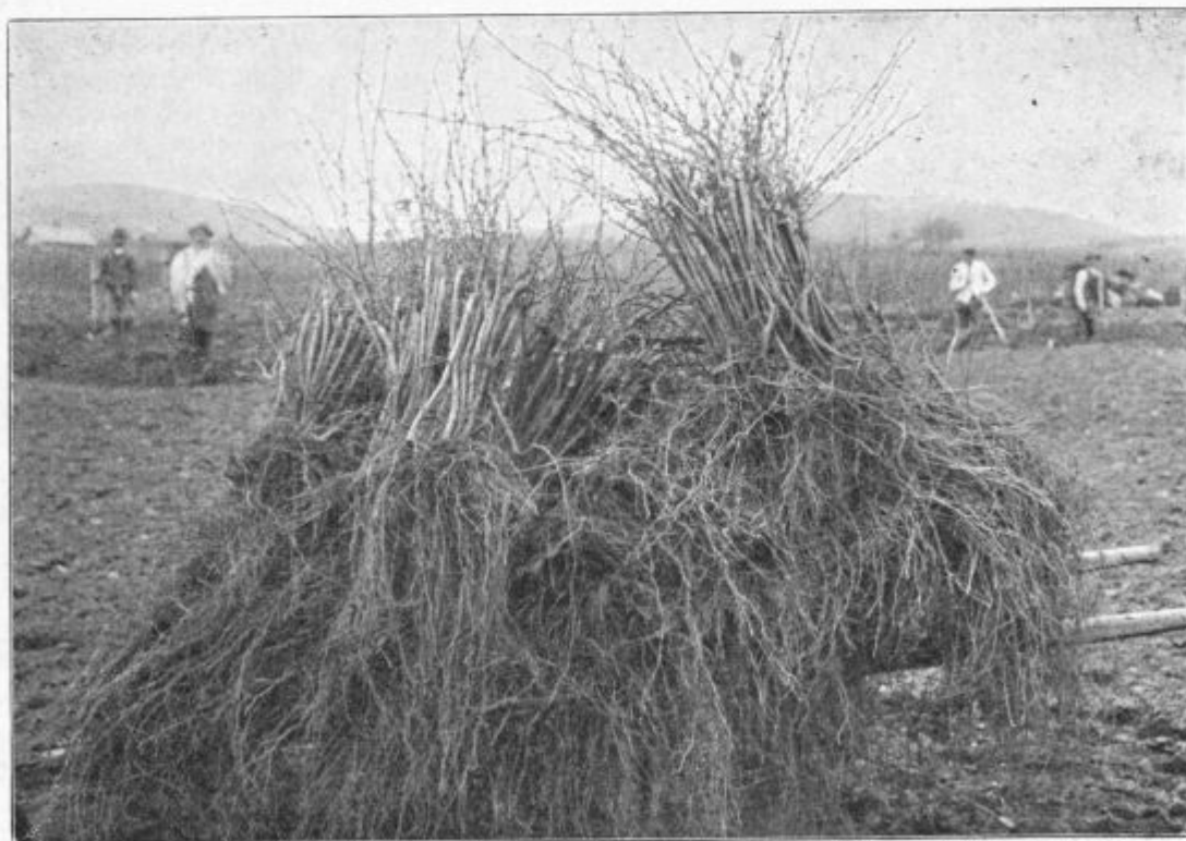
Podoba 48. Enoletne cepljenke, pridelane od kmečkoga vinogradnika na Nižjavevstrijskem.

vremenu, meseca junija in julija, tudi po dvakrat na teden ponoviti. Seveda gre škropljenje takih mladih trt hitro od rok. Posebno pripraven je za to takozvani