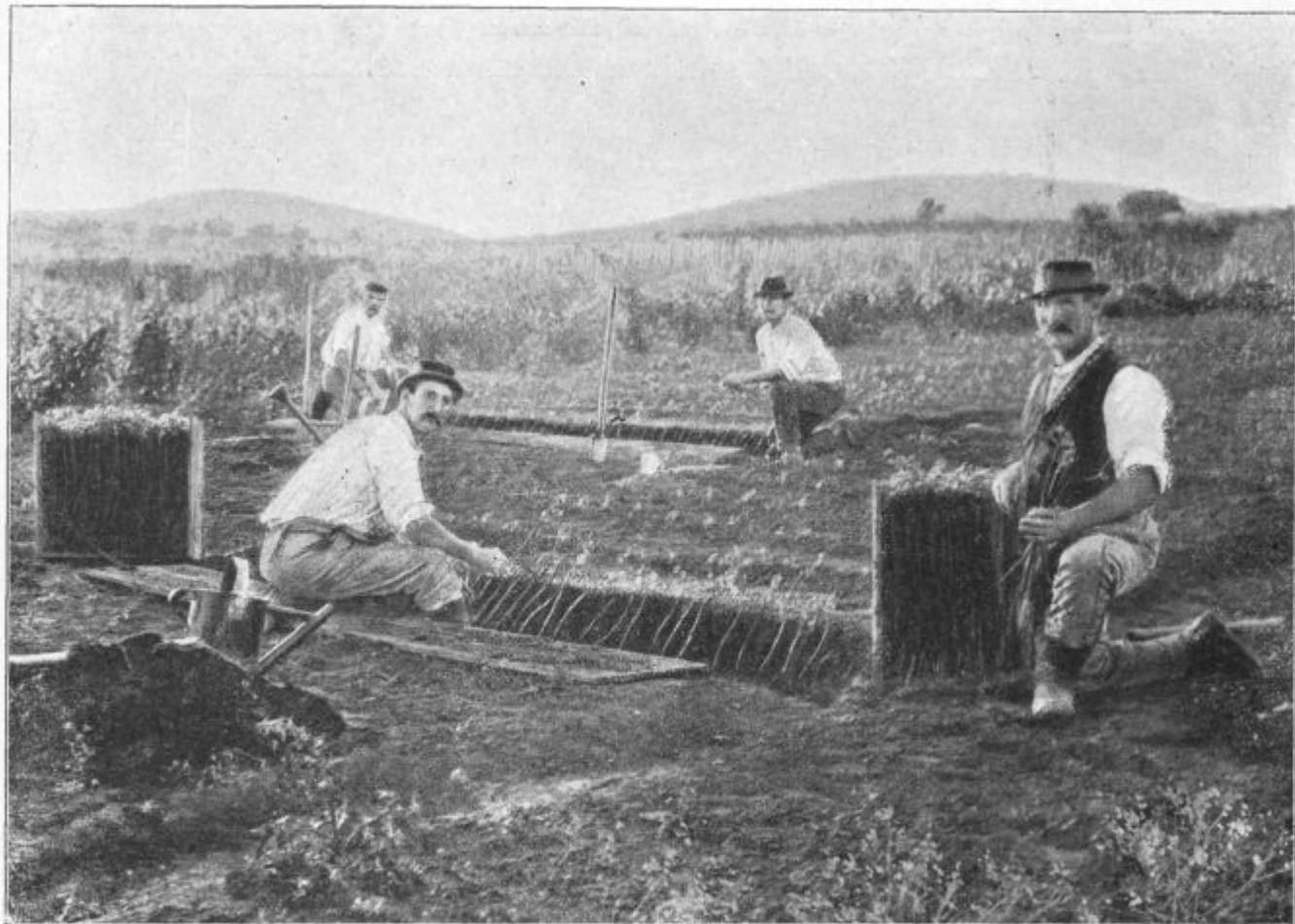
Podoba 46. Vlaganje cepljenk v trtnico.

Obseg: Siljenje ali káljenje ameriških cepljenih klučev. — Za planinarstvo. — Vprašanja in odgovori. — Kaj delajo naše podružnice. — Kmetijske novice — Družbene vesti. — Uradne vesti c. kr. kmet. družbe kranjske. — Listnica uredništva. — Tržne cene. — Inserati.