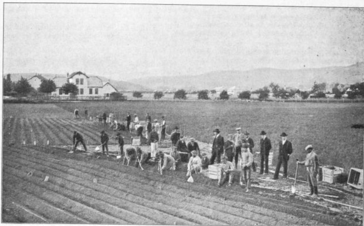
Podoba 50. Vlaganje cepljenk v skupno občinsko trtnico v Langenloisu na Nižjeavstrijskem. Vsak vinogradnik mora delati en dan, če se udeleži s 1000 cepljenkami.

se trte dobro zrasle, kajti močne korenine ali bolj močno mladiko trta lahko tudi v poznejših letih naredi, zarasti se pa znatno bolj ne more.