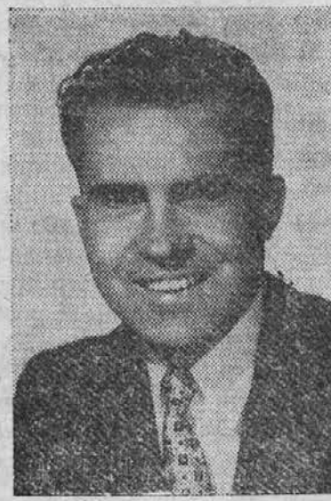
Richard M. Nixon