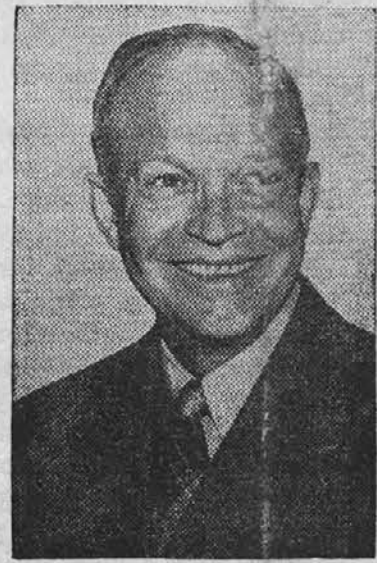
Dwight D. Eisenhower