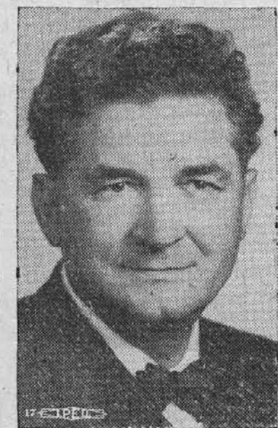
Frank J. Lausche

Jutri zvečer ob osmih se vrši redna seja društva Napredne Slovence št. 137 SNP v navadnih prostorih Slov. nar. doma na St. Clair Ave. Članice so vabljenje, da se udeležijo v polnem številu.