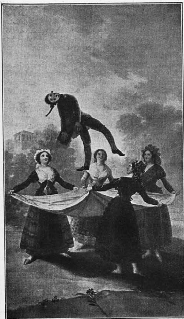
Francisco Goya: Ženske in možicelj. (Madrid, Prado.)

Darilo, ki ga družica položi na kozarec, ko med petjem camarju napije, je bil v starih časih svilen robec, kakršen spada k moški narodni noši; danes dajejo kravato. Za to darilo mora camar čez teden ali dva oskrbeti »jesih«, to je majhno ponovitev ženitovanjske veselice. Tudi pesem jo omenja: