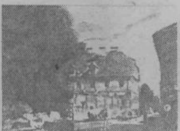
DESETNICA, barvni lesorez 1943

Ne smemo pa prezreti njegovih številnih ilustracij in EX-librisov. Spominimo se le njegovih Rdečih lučk, ilustracij Sonetnega venca in Kralja Matjaža.