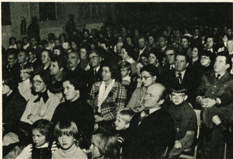
Letošnja proslava ob Dnevu republike je bila v Delavskem domu na Viru, kateri je prisostvovalo veliko delovnih ljudi in občanov iz vse naše občine

več pozornosti posvetili nakupu značk, prospektov in razglednic.