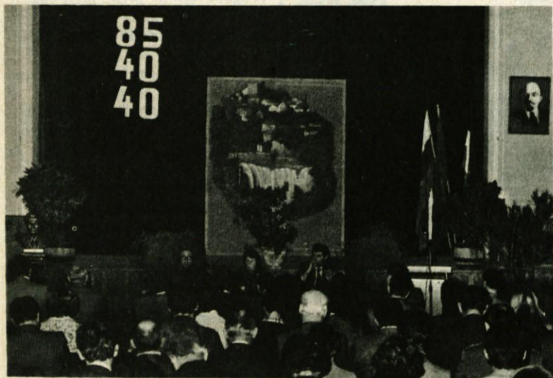
Med zasedanjem občinske volilne konference v Delavskem domu na Viru

munistov v naši občini in to na številčnem področju, kot tudi na področju organiziranosti in idejnopolitičnega usposabljanja. Poleg tega je podal celotni pregled delovanja članov ZK v vseh sredinah in na posameznih področjih