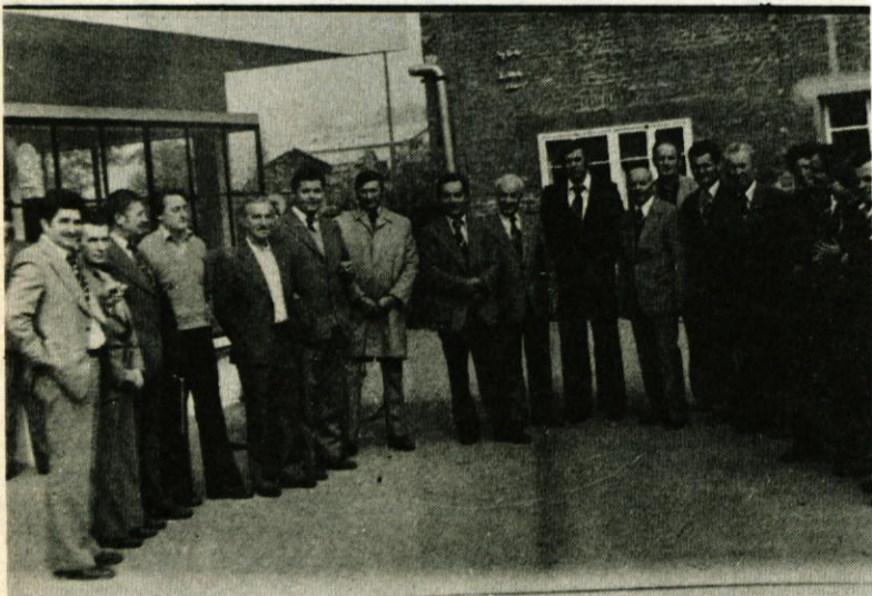
Srečanje predstavnikov KS Vir s predstavniki KS Belišče

za celulozno in papirno industrijo, hidravlične stiskalnice za gumarsko industrijo, silosno in drugo opremo.