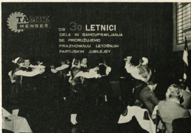
V kulturnem programu so nastopili tudi člani Folklorne skupine Svobode Mengeš

„Vaš kolektiv je občutil boj za obstanek, pa tudi trdo delo, ki je