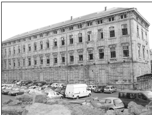
Kompleks nekdanje sladkorne rafinerije (kompleks Rikard Benčič) na Reki.

Simpozij se je izkazal kot dobra priložnost za izmenjavo mnenj in izkušenj različnih strokovnjakov in študentov iz treh držav na področju reševanja industrijske arhitekture. Organizatorji, študentje 4. letnika umetnostne zgodovine, so vložili veliko truda in energije za uspešno pripravljen simpozij tako po vsebinski kot tudi organizacijski plati. Sama organizacija in izvedba simpozija nista nič zaostajali za podobnimi simpoziji uveljavljenih znanstvenih institucij in združenj. Projekt so podprli tudi profesorji Filozofske fakultete na Reki in s tem pokazali podporo tovrstnim srečanjem. Med udeleženci se je pokazala visoka stopnja kritičnosti in želja po iskanju konstruktivnih rešitev za posamezne spomenike. Vsi udeleženci smo se soglasno strinjali, da je potrebno nadaljevati s takšnimi srečanja tudi v bodoče. Tako hrvaški kot tudi bosansko-hercegovski kolegi so izrazili željo, da bi naslednje srečanje potekalo v Sloveniji v organizaciji slovenskih študentov umetnostne zgodovine.