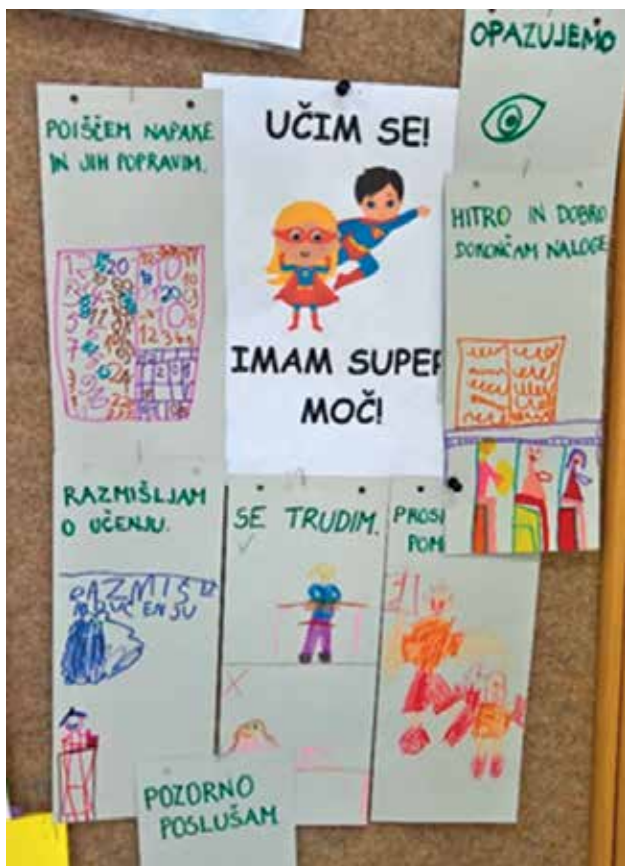
► SLIKA 4: Orodje Učim se – imam supermoč!

Starše sem skupaj z učenci, takratnimi tretješolci, povabila na roditeljski sestanek. Uradni del sestanka z vsemi »resnimi« točkami dnevnega reda smo izvedli v razredu, kasneje pa smo se z namenom povezovanja in sodelovanja v šolski telovadnici igrali različne štafetne igre. Ta del sestanka so v celoti načrtovali, pripravili in izvedli učenci. Ob koncu sestanka se je vsak roditelj s pomočjo iztočnic v oblakih pogovarjal s svojim otrokom. Iztočnice so bile: Razveselilo me je ..., Presenetilo me je ..., Ponosen sem na tebe, ker ..., Današnje popoldne s teboj je bilo ... Ta izkušnja je bila za vse navzoče izjemno pozitivna, zato sem v lanskem šolskem letu s prvošolci in njihovimi starši v šolski telovadnici izvedla celoten roditeljski sestanek. »Resni« del sestanka smo imeli kar na švedskih klopih, ki smo jih postavili v obliki trikotnika. Namen igrivega dela roditeljskega sestanka pa je bil, staršem predstaviti orodja moči, ki nam pomagajo pri delu v razredu. Igrali smo se različne gibalne in socialne igre, pri katerih so morali med seboj sodelovati starši posebej in otroci posebej, starši z vsemi otroki, roditelj s svojim otrokom. Ob koncu so se s pomočjo iztočnic za pogovor v oblakih pogovarjali s svojim otrokom.