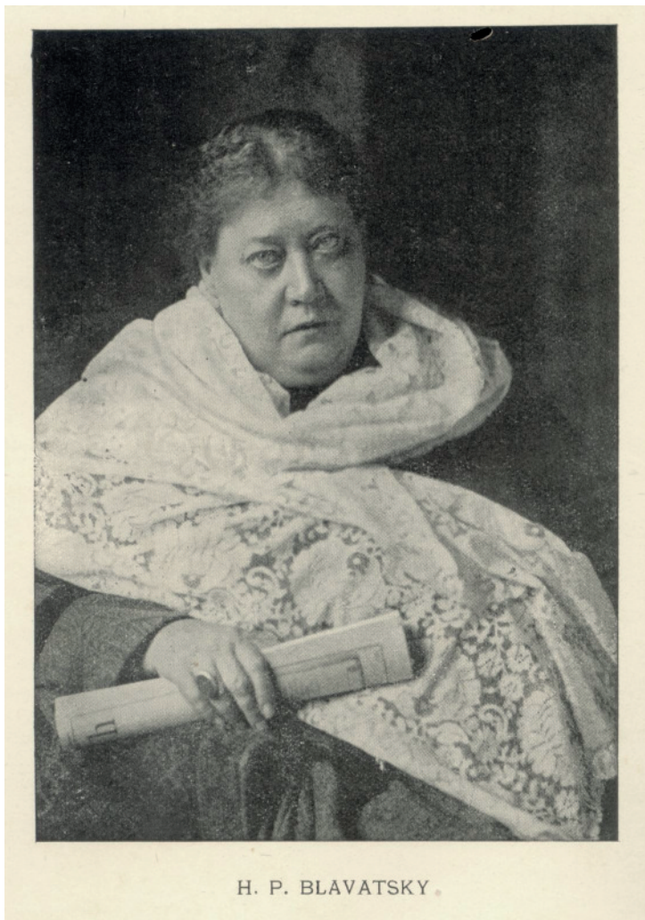
H. P. BLAVATSKY.

lovati. To lekcijo predajam vam, začetnikom, v upanju, da boste na zgodnjih stopnjah vaše življenjske poti pripravljeni poslušati nasvet starejšega brata, katerega izkušnja v psihičnih stvareh se vleče že petinpetdeset let ...”