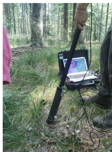
Slika 3: Prikaz snemanja drobnih korenin s kamero v mini-rizotronih na terenu