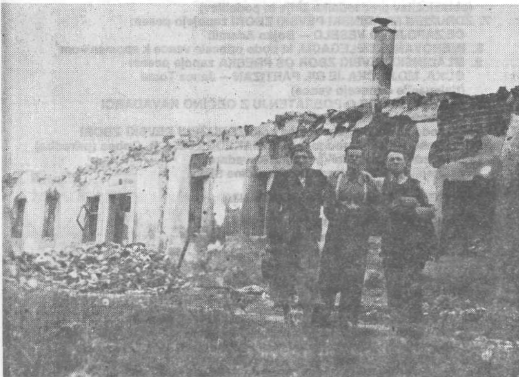
Rašica leta 1941

Sedaj pa še nekaj o prireditvenem prostoru letošnje občinske proslave. Ta bo na gozdni jasi ob poti, ki vodi na razgledni stolp. Jasa je dovolj velika, da bo sprejela vse udeležence proslave, slavnostna tribuna je že postavljena, tudi stojnice za okrepčila so se že pojavile, tako, da bo ob primernem vremenu res prijetno na občinski proslavi. Prepričani smo, da bodo Raščani dober gostitelj, tako kot so bili v začetku oboroženega boja in tako kot so številnim izletnikom.