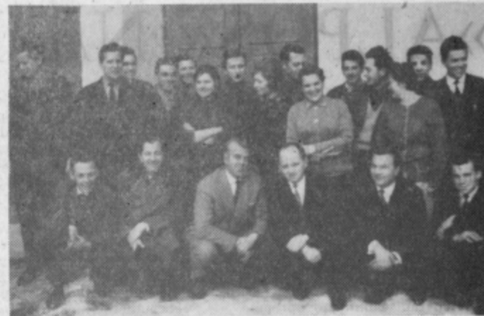
Tečajniki so se veselili, da so uspešno zaključili šolo, postavili pred reporterjev objekt

Na Sladki gori so si izključno z lastnimi sredstvi in prostovoljnimi delom že predlanskim zgradili vaški gasilski dom. Blizu šole so odstopili zemljišče, vrli Sladkogorčani so hitro zavihali rokave in kmalu je bil domček pod streho. Slovesno so ga tudi odprli, čeprav še ni bil popolnoma dograjen. Pozimi pa je močan vihar, ki je populil celo tri jabolane, porušil tudi stene, ki niso bile okrepljene z vmesnimi zidovi. Zavarovalnica je predtem zavarovala dom, toda še do danes Sladkogorčanom niso izplačali nobene odškodnine. Na občini tudi niso mogli ničesar ukreniti. Ves trud in znoj, ki so ga vložili v objekt, je danes samo žalosten kup ruševin. Pri krajevni organizaciji SZDL pa pravijo, da poguma še niso izgubili. Če bi dobili vsaj nekaj odškodnine za nesrečo, bi se takoj spet prostovoljno lotili dela in bi si zgradili dom ter pripravili prostore za družabno življenje. Samo, kaj napraviti? Vse skupaj je zelo čudno?