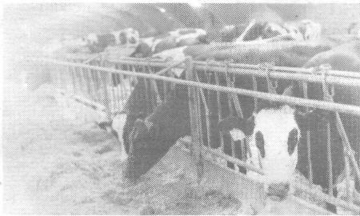
V farmi Gmajnice dajo krave povprečno okrog pet tisoč litrov mleka letno. Z boljšim krmiljenjem in skrbjo za živino bi lahko dosegli do sedem tisoč litrov. To pa ne bo lahko doseči, saj imajo na farmi še vedno nadpovprečno izločanje krav iz črede.

Obisk na Brestu je pokazal, da enajst delavcev marljivo opravlja svoje delo. Nekoliko več