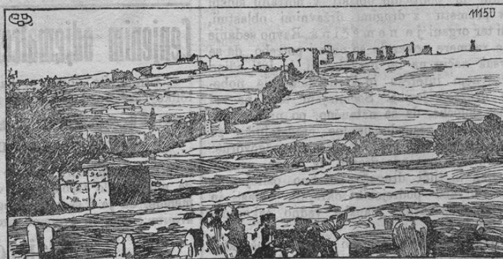
Das Fort Kara-Burun

Vkljub temu, da se je Grška v tej svetovni vojni izjavila nepristransko, so angleški in francoski naši sovražniki ednostavno zasedli važne dele njene ozemlja, kar se jim je v vojaškem oziru zdelo potrebno. Grška je sicer protestirala, ali za naše sovražnike ne pomeni pravica nič drugega nego raztrgani kos papirja. Med drugimi kraji so ti zatiralci svobode zasedli tudi fort Kara-Burun,