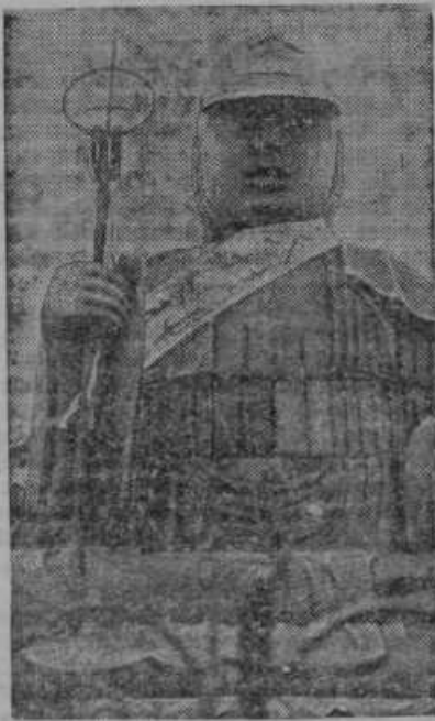
Vojna agitacija na Japonskem. V budističnem svetišču v Tokiu so oblekli vojaki Budov kip v vojaško uniformo

SEJMARJI! Za birme in božja pota dobite za posebno nizko ceno naše molitvenike, rožne vence in druge predmete. Zglasite se v prodajalni Tiskarne sv. Cirila v Mariboru ali Ptuj!