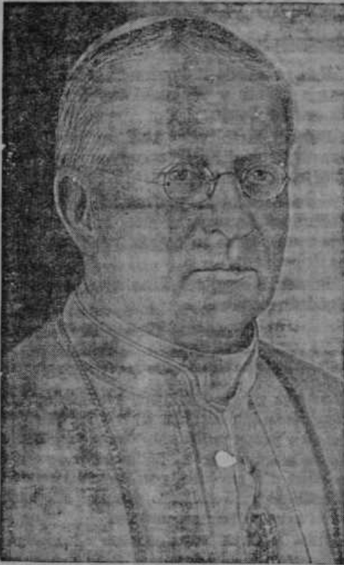
31. maja je stopil sv. Oče Pij XI. v 82. leto