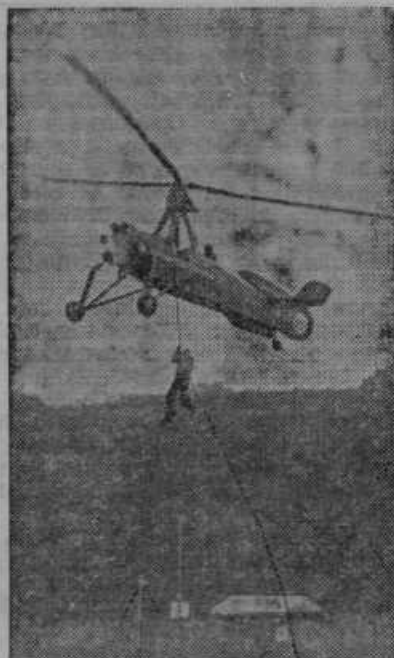
Francoski letalski umetnik razkazuje v Saint Germain svoje izredno drzne letalske spretnosti

III. redni tabor pri Sv. Trojici v Slov. gor. od 11.—12. junija. Veliko zanimanje po vseh III. redniških okrožjih vlada med našim ljudstvom. Kdor bo le mogel bo poromal na naš tabor. Romarji-III. redniški in vsi drugi nikar se ne ustrašite, če bo vreme malo ponagajalo. Vsi pridite peš, z avtomobili, z vozovi in sicer že v soboto 11. junija ob 6. uri k sprejemu ml. g. prošta škofovega odposlanca dr. M. Vraberja. Bližnje III. redniške pa vabimo, da se udeležijo tridnevni duhovnih vaj. Nad vse lep bo tudi prizor, ko se bo premikala v mraku velika procesija z baldijami. Po procesiji pa pojdite vsi na lepo versko igro »Teofil«. Jubilarji, ki so se priglasili se imajo do 9. ure zjutraj v nedeljo zbrati na telovadišču. Za vse bo preskrbljeno tudi za ceneno prehrano. Samo pridite vsi in pridite z veselim srcem in s pesmijo na ustih po