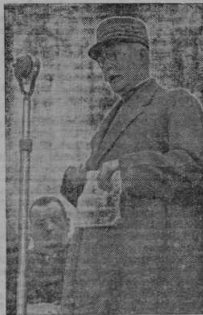
Francoski maršal Pétain, ki je zmagal v svetovni vojni pri trdnjavi Verdun, govori pri vojaški slavnosti