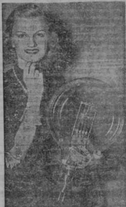
Električna žarnica za 10.000 vatov je bila na vpogled na elektrotehnični razstavi v Filadelfiji v Združenih državah Severne Amerike.

vzgledu našega očeta sv. Frančiška. Vsi drugi iskreno vabljени!