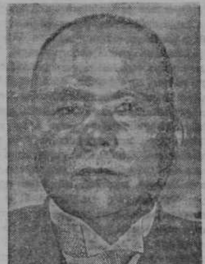
General Ugaki, novi japonski zunanji minister

Strahovita razdejanja v Kantonu. V zadnjem času tedensko oznamamo, kako kažejo vse predpriprave, da bodo skušali Japonci zavzeti najvažnejše kitajsko trgovsko mesto Kanton, ka-