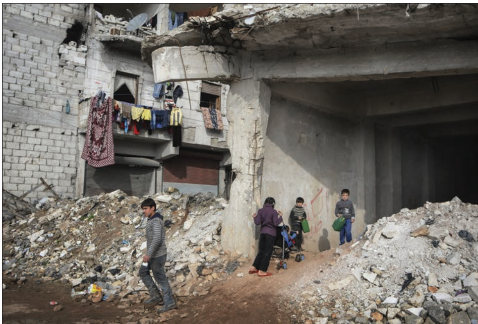
Slika 13: Otroška igra in vsakdanje življenje med ruševinami (Alep, Sirija, 2015; Foto: Teun Anthony Voeten, ICRC Audiovisual Archives, V-P-SY-E-00363).