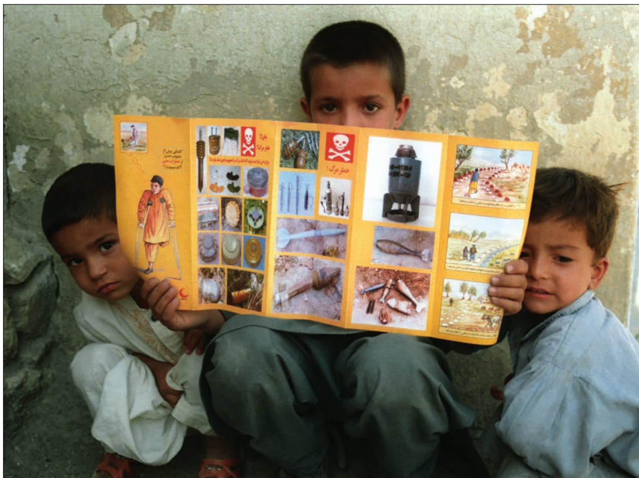
Slika 8: Otroci ob prebiranju brošure o nevarnosti min (Kabul, Afganistan, 2003; Foto: Farzana Wahidy, ICRC Audiovisual Archives, V-P-AF-E-00214).

že mrtev» (Vasev, 2018). MKS je bilo ustanovljeno z Rimskim statutom leta 1998, ki je stopil v veljavo 1. julija 2002. Sodišče je pristojno za obravnavo mednarodnih zločinov, in sicer genocida, zločinov proti človeštvu, vojnih zločinov in zločinov agresije, ki so se zgodili v obdobju po njegovi ustanovitvi. Boltonov odziv je bil posledica tega, da je glavna tožilka MKS-ja v Haagu 20. novembra 2017 podala predlog, da bi se sprožila preiskava glede domnevnih vojnih zločinov in zločinov proti človečnosti v zvezi z obo-roženim spopadom v Islamski republiki Afganistan po 1. maju 2003. 9 Bolton je torej podal jasno sporočilo, da ZDA odločitev sodišča ne bodo spoštovali niti ne nameravajo z njim sodelovati.