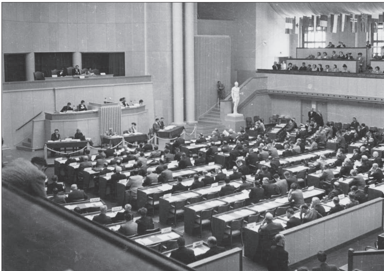
Slika 2: Diplomatska konferenca za revizijo Ženevskih konvencij, avgust 1949.

okupiran s strani sovražne sile). Vendar, ker se tedaj, po mnenju Picteta, še ni kazala nujnost sprejetja konvencije (Pictet, 1958, 4), je osnutek do druge svetovne vojne ostal le osnutek. O njem bi se moralo odločiti na konferenci leta 1940, kar je bilo že prepozno. Čeprav je ICRC ob začetku vojne predlagal, da bi se države tekom spopadov vseeno ravnale po osnutku, so se to zavrnilo. Je pa odbor uspel od večine držav pridobiti zagotovila, da bodo s civilnimi interniranci ravnali v skladu s Konvencijo o ravnanju z vojnimi ujetniki . Kljub temu pa to še zdaleč ni uredilo te problematike, saj so ob zagotovilih s strani nekaterih držav lahko pomagali le majhnemu deležu vseh civilnih internirancev in drugih civilnih žrtev v času vojne (Picciaredda, 2003, 57; Pictet, 1958, 5).