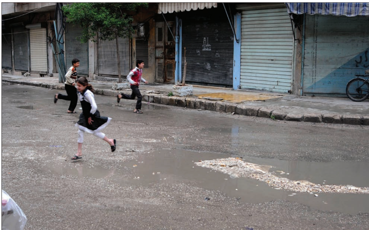
Slika 10: Mladi Sirci bežijo pred ostrostrelci (Alep, Sirija, 2013; Foto: Teun Anthony Voeten, ICRC Audiovisual Archives, V-P-SY-E-00278).

učinkovitost izhaja ravno iz ugotovitve, da Rimski statut, katerega ratifikacija pomeni neposredni pristop države k članstvu MKS, nima potrebne mednarodne podpore. 10 Med drugim statuta niso ratificirali Iran, Irak, Kitajska, Sirija, Ukrajina in ZDA, Rusija pa je od statuta odstopila novembra 2016, 11 po tem ko je MKS objavilo poročilo v katerem je aneksijo Krima in Sevastopola označilo za okupacijo ter izpostavilo prepričanje, da »[r]azpoložljive informacije kažejo, da razmere na ozemlju Krima in Sevastopola predstavljajo mednarodni oboroženi spopad med Ukrajino in Rusko federacijo« (ICC Report, 2016, odstavek 158). V praksi to pomeni, da države, ki niso pristopnice, niso zavezane k sodelovanju v preiskavah in izročanju domnevnih vojnih zločincev.