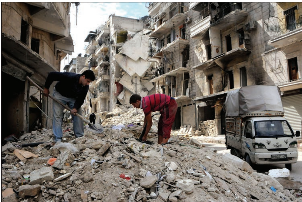
Slika 11: Prebivalci čistijo ruševine po bombnem napadu v katerem je bila porušena večstanovanjska stavba (Alep, Sirija, 2013; Foto: Teun Anthony Voeten, ICRC Audiovisual Archives, V-P-SY-E-00283).