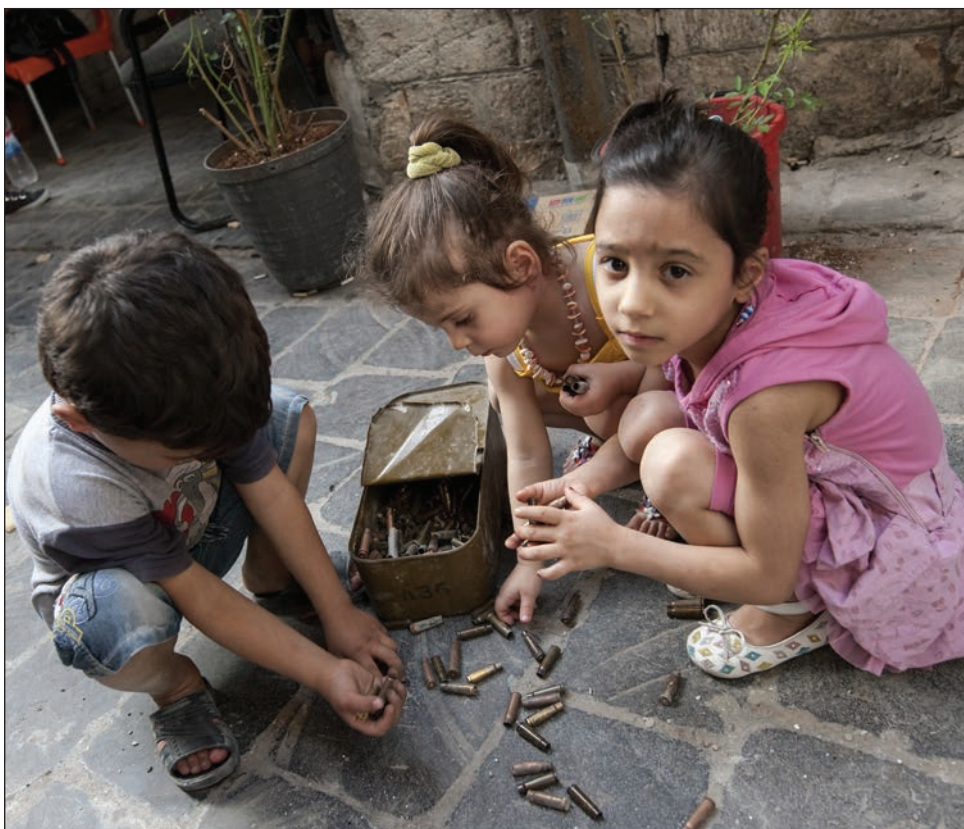
Slika 12: Otroci v igri zbirajo naboje (Alep, Sirija, 2013; Foto: Hagop Vanesian, ICRC Audiovisual Archives, V-P-SY-E-00325).