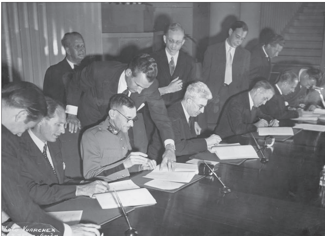
Slika 3: Švicarska delegacija podpisuje nove Ženevske konvencije, 12. avgust 1949.

pomenil, da bodo potrebne velike spremembe. Kar se je v obdobju pred prvo svetovno vojno zdelo nepredstavljivo, torej potreba po konvenciji namenjeni posebej zaščiti civilistov, je po drugi svetovni vojni postala nuja. Tako kot za prvo svetovno vojno tudi za drugo svetovno vojno nimamo povsem natančnih podatkov o deležu civilnih žrtev. Najnovejše raziskave kažejo, da je kot posledica vojaških aktivnosti ali zločinov proti človeštvu (torej neposredne žrtve vojne) delež civilnih žrtev znašal 60 % (REPERES, 2011b). Zato je bilo prvo povojno obdobje zaznamovano s sprejemanjem novih Ženevskih konvencij, ki so povsem nadomestile stare, poleg tega pa s sprejemanjem prve Konvencije o zaščiti civilnih oseb v času vojne .