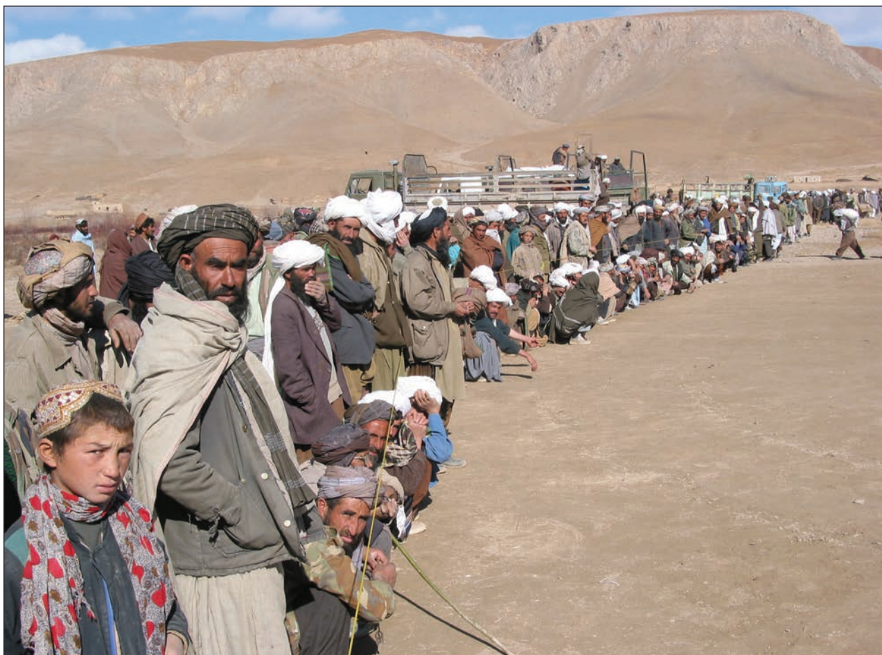
Slika 6: Vojna v Afganistanu je od leta 2001 povzročila množično trpljenje civilnega prebivalstva, ki je podvrženo revščini in pomanjkanju. Na fotografiji civilisti potrpežljivo čakajo na pakete hrane, ki jih delijo predstavniki ICRC (Afganistan, Provinca Ghor, 2002; Foto: Patrick Bourgeois, ICRC Audiovisual Archives, V-P-AF-E-00128).

cilje, njihovo izvajanje povzroča politične in vojaške težave, za začetek preživetja Države. Zato se ni bilo mogoče izogniti napetosti med političnimi in humanitarnimi zahtevami. Takšna napetost je v naravi pravilnika o oboroženih spopadih, ki, kot vemo, temelji na kompromisu (Sandoz, Swinarski & Zimmermann, 1987, xxxiv).