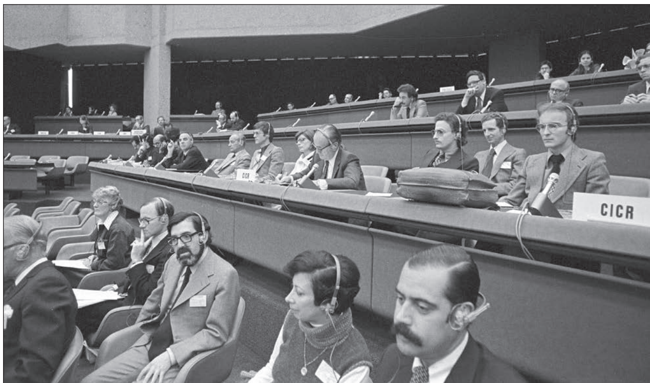
Slika 4: Diplomatska konferenca o potrditvi in razvoju mednarodnega humanitarnega prava, ki se uporablja v oboroženih spopadih, ki je potekala od leta 1974 do 1977 v Ženevi.