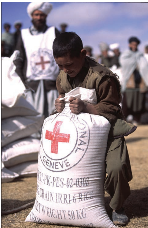
Slika 7: Deček ob vreči riža, ki jih civilistom delijo predstavniki ICRC (Afganistan, Provinca Ghor, 2002; Foto: Stephane Victor, ICRC Audiovisual Archives, V-P-AF-E-00195).

manj imuni na vojno. Strahotna statistika namreč kaže, da delež žrtev med civilisti narašča premo sorazmerno z njihovo zaščito – bolj kot so civilisti zaščiteni, več je med njimi žrtev. Kljub vsemu bi bilo prenačljeno zaključiti, da Ženevske konvencije in obstoječa zaščita civilistov nista učinkoviti. Veliko lažje namreč obsodimo vse tiste zločine, ki jih konvencije niso preprečile, kot tiste, ki bi se zgodili, če te zaščite ne bi bilo.