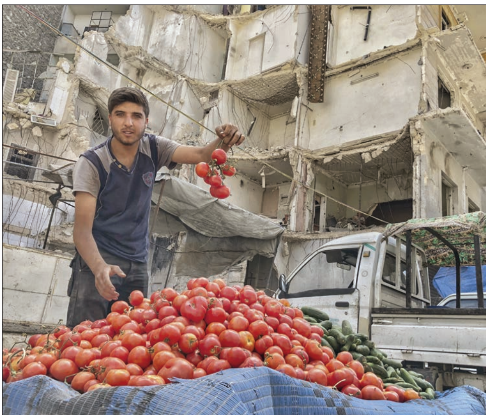
Slika 14: V času ramadana je mesto vedno živahno. Na fotografiji trgovec, obdan z ruševinami, prodaja zelenjavo (Alep, Sirija, 2018; Foto: Ali Yousef, ICRC Audiovisual Archives, V-P-SY-E-00825).