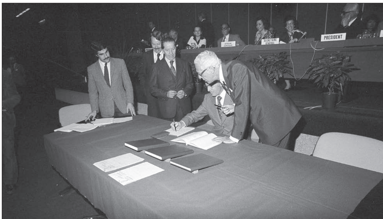
Slika 5: Podpisovanje Protokola I in Protokola II, 8. junij 1977 (Foto: Gérard Leblanc, ICRC Audiovisual Archives, V-P-CER-N-00025-18).