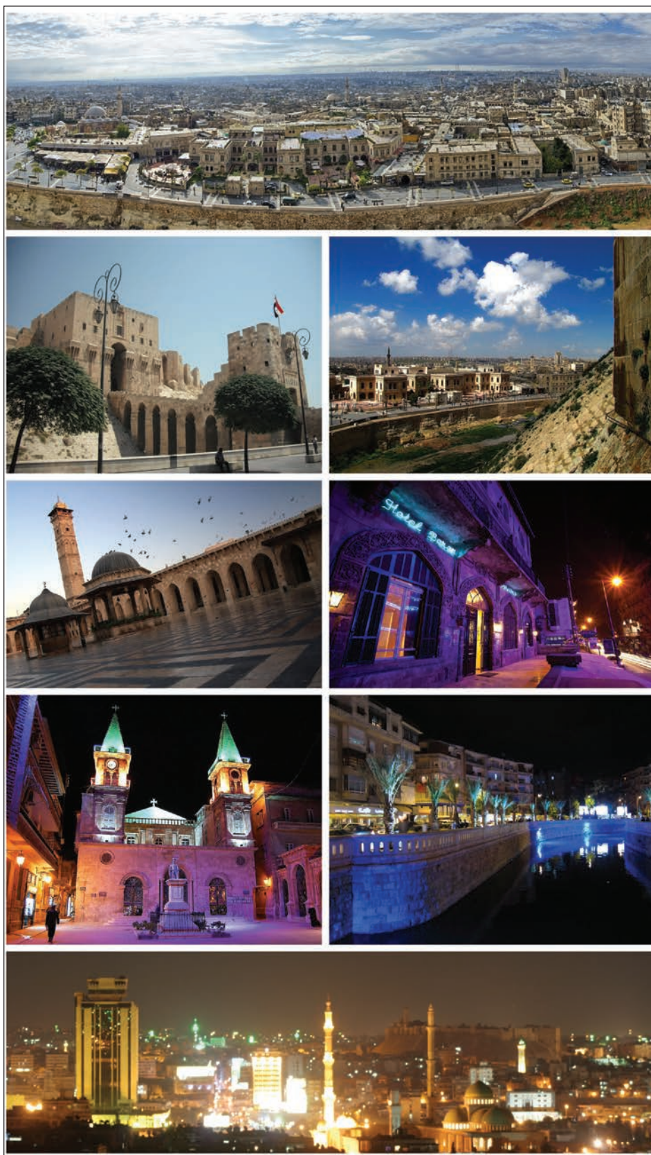
Slika 9: Alep (Sirija) pred vojno, ki se je začela leta 2011.