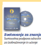
Svetovanje za znanje Svetovalna podpora odraslim za izobraževanje in učenje

1 Pred vključitvijo v izobraževanje lahko svetovalci: