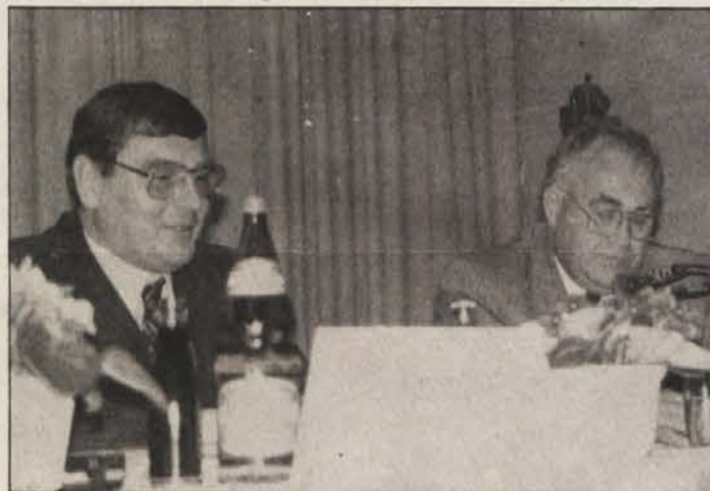
Z gospodarskega posveta v Pliberku

DJEKŠE. – Na Djekšah so lahko dvakrat zadovoljni: prvič, zadolžitev po občani znaša le 225,31 šilinga, kar je v primerjavi z drugimi občinami zelo malo, drugič pa se končno obeta zadovoljiva rešitev vprašanja oskrbe z vodo. Občina je namreč podpisala pogodbo z družino Polessnig, kar ji zagotavlja dovolj velik rezervoar. Na Djekšah so najprej hoteli graditi lasten vodovod, toda načrt so morali opustiti, ker voda izvira prav pod deponijo smeti.