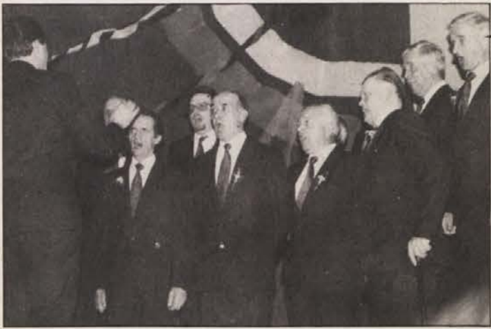
MoPZ „Foltej Hartman“