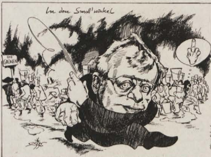
Aus „Der Standard“, 23. März 1990