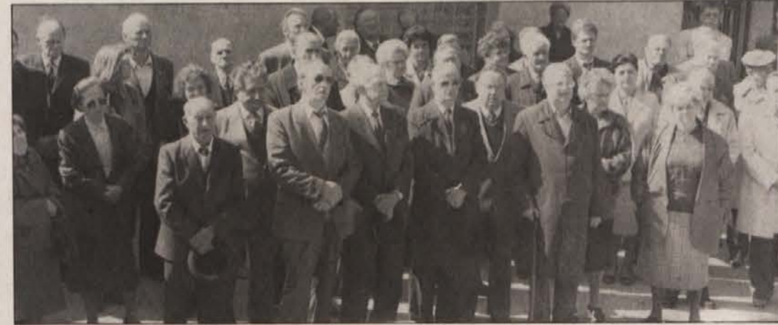
V Kapli so se poklonili 186 domačim žrtvam nacifašizma.