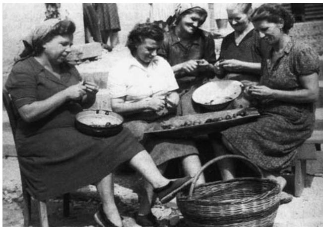
Ohranjanje in obujanje tradicionalnega načina bivanja v Brdih ... Vir: Marinič 1999: 294