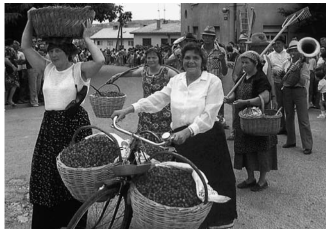
... Praznik češenj. Vir: Bažato 1992: 86