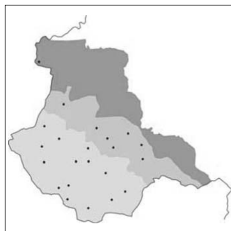
Prodaja sadja in vina

Inventarizacija turističnih destinacij v krajini Goroških brd (točka = naselje).