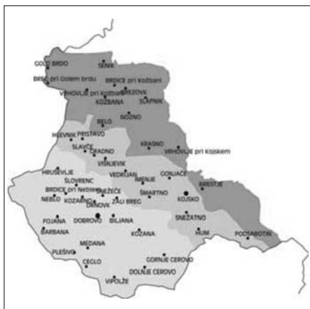
Naselja v Goriških brdih