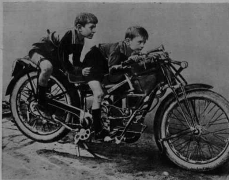
Oba sinova italijanskega nasilnika Mussolinija prav tako ljubita vrstolomna podjetja kot oče. — Tu čakata na začetek neke motorne tekme.