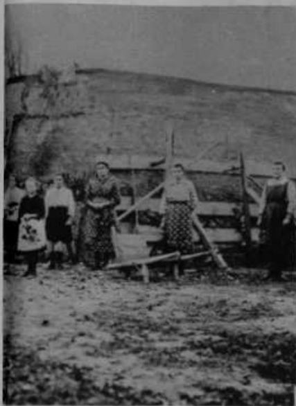
Postavljajo nov dom. Potrebno je Slika nam predstavlja pečnico, ki jo bodo uporabili za novi dom.

Gornja slika nam kaže eksplozijo ladje, kar je hotela neka ameriška filmska družba spraviti na platno. Kupila je star parnik, naložila vanj 1000 centov dinamita in veliko množino smodnika ter pognala ladjo v zrak. Ves prizor, to se pravi: vsak trenutek tega prizora je posnel fotografirni aparat na film, ki se potem razmnoži kot vsaka fotografija ter nastopi svojo pot po svetu. Ni čuda, da naprava nekaterih velikih filmov stane 200 do 400 milijonov dinarjev.