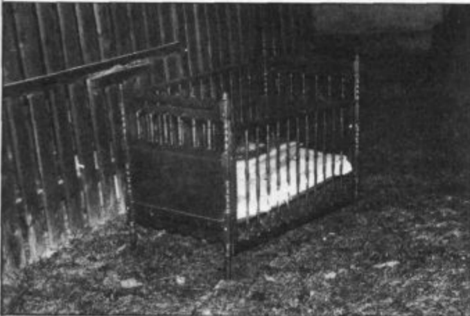
Na dvorišču ...

Dogajalo se je tole: 22-letna B. R. iz Velenja se je odločila, da se nasilno vseli v eno od stanovanj