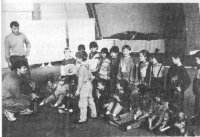
Teniška pripravjalnica za otroke (vos)