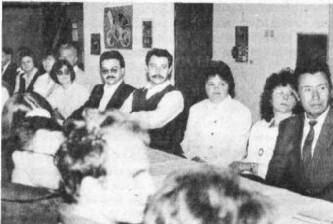
Ne zanimajo jih strankarske zdrahe, ampak skrb za vsako prizadeto osebo in njegovo družino. Pri tem so jim tesno stali ob strani nekateri predstavniki bivše občine Velenje, delavci šole Šmartno Velenje in tudi njihova zveza