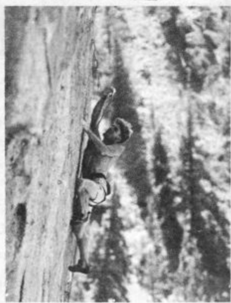
Smer: "Just do it" Bct v plezališču Smith rock, Oregon

Po razmisleku sva se odločila, da bi bilo vredno obiskati Yosemite za daljši čas,