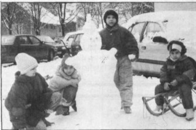
Bo sneg med počitnicami le velika želja?

banje, nagrada pa bo izlet v Gardaland. In kaj to je? Od ponedeljak do petka bo 10 prostovoljcev iz Gimnazije skupaj s počitnikarji, ki se jim lahko pridružijo vsak dan ob 10. uri na Titovem trgu, iskalo skladi, raziskovali bodo Šaleško dolino, se igrali,