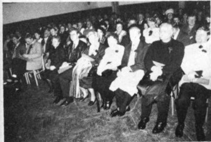
Dobitniki letošnjih priznanj in zlatih plaket

dni že sklenili, zadnje med njimi pa se bodo zvrstile do konca februarja in začetka marca.