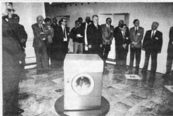
Župani, poslanci in svetniki so si z zanimanjem ogledali, kako nastajajo gospodinjski aparati