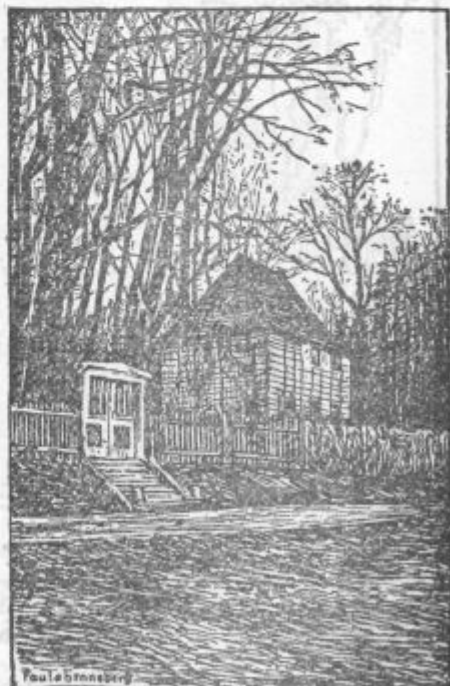
Pavla Honneberg: GOETHEJEVA VRTNA HIŠA v Weimarju

ILLUSTRIRTE ZEITUNG LEIPZIG št. 4806 priobčuje naslednje prispevke s številnimi ilustracijami: Budapešta, kraljica