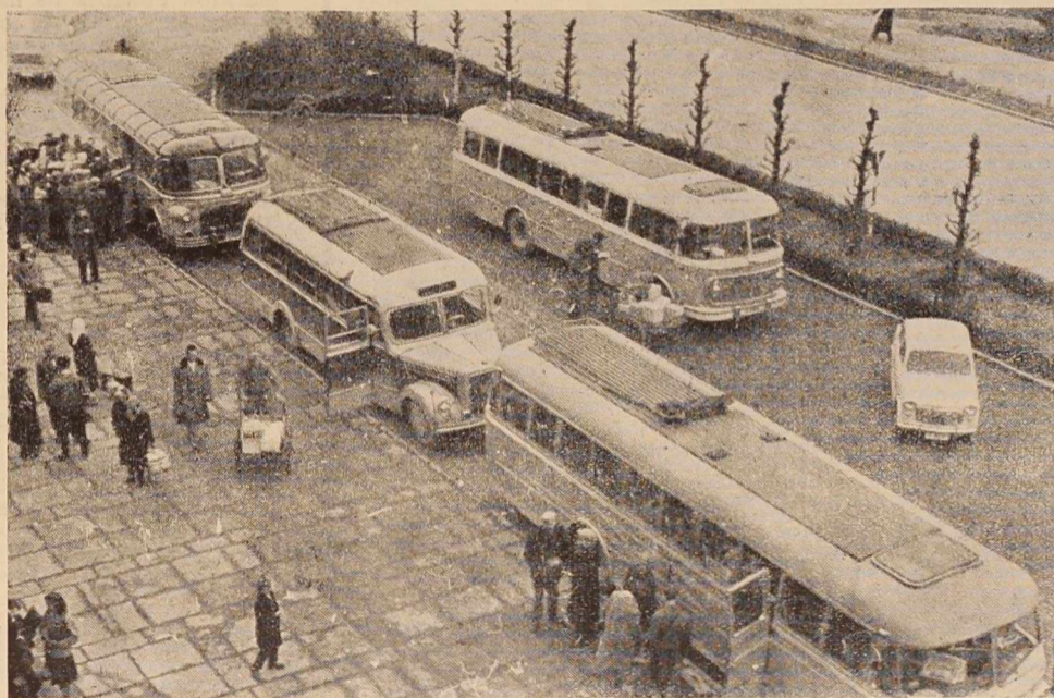
Za vsakogar, ki potuje z avtobusom — kakor tudi za avtobusna podjetja — je avtobusna postaja v Murski Soboti problem št. 1

darstva Gornja Radgona s sorodnim posestvom na Kape- (Nadaljevanje na 6. strani)