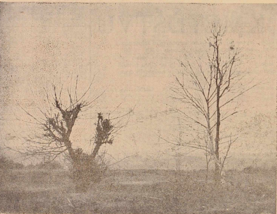
Včeraj in predvčerajšnjim smo bili deležni prve pomladanske toplote. Ali bo še zima? Če bi verjeli napovedim nekaterih vremenoslovcev, bi morali reči, da je najhujše mimo, čeprav je bila letošnja zima »na obroke«. Bolj kot prejšnja leta pa je bil mrzel december. Sicer pa — otroci so že staknili prve zvončke!

Drugi organ naj bi bil Svet federacije. Ta bi bil organ pri predsedniku republike, (Nadaljevanje na 3. strani)