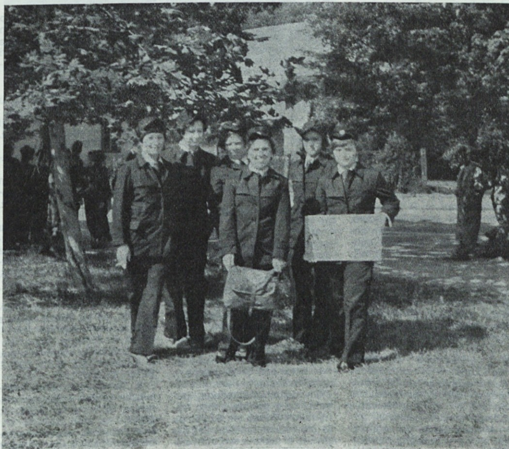
Druga ekipa PMP