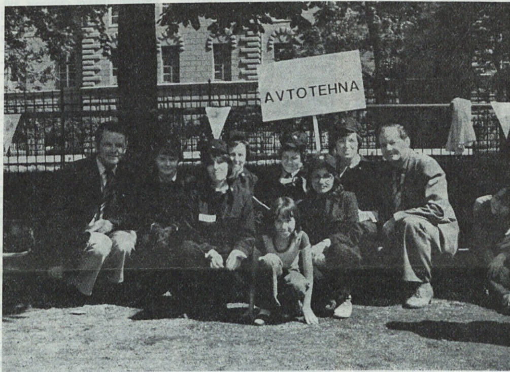
Prva ekipa PMP

V letošnjem jubilejnem letu je med nešteti manifestacijami bilo v mesecu maju tudi tekmovanje v nudenju prve pomoči oziroma reševanju ljudi. Kot že večkrat do sedaj so na tem tekmovanju sodelovale tudi članice prve medicinske pomoči (PMP) Civilne zaščite Avtotehne.