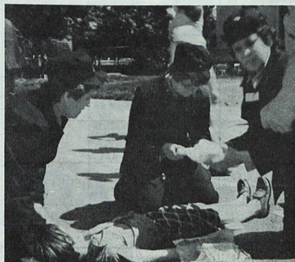
I. trojka Prve ekipe