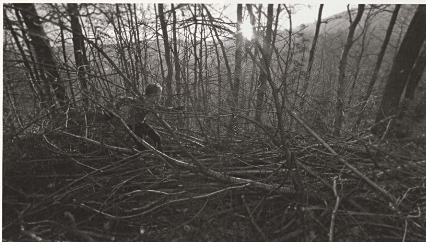
Rejnica