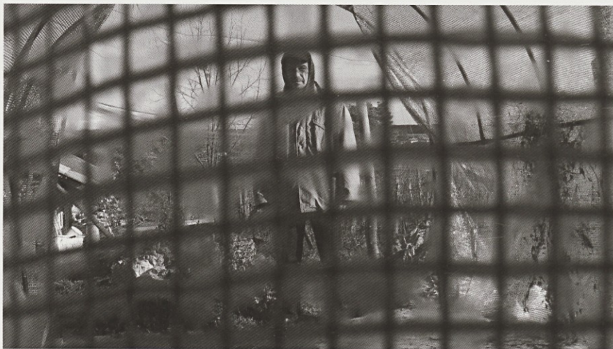
Free Božidar

Zdrav duh v zdravem truplu – truplo je seveda telo , pojasni geslo telovadnega društva Sokol vodja metliškega sokolskega društva. Ob njihovi 150-letnici ni članstvo v metliških Sokolih nič manj izbrano, kot društvu s takim stažem pritiče, kandidati morajo namreč opraviti vrsto zahtevnih preizkusov (med drugim tek pod mizo, ne da bi pri tem polili špricer in demonstracijo sokolskega šopirjenja ...); četudi so njihovi nastopi nekoliko »ad libitum«, kot se izrazi isti sogovornik v navdušujoče duhovitem dokumentarnem filmu Eme Muc. Režiserki, ki je menda sama Metličanka, je v kratki formi uspelo zajeti očarljive posebnosti domačega društva, ki s svojo ljubeznijo do pečenke morda niso ravno tisto, kar bi si tradicionalno predstavljali pod imenom Sokoli. Pri tem se posluži naravne fotogeničnosti njihovih telovadnih formacij in spodletelih nastopov v tujini, ki Sokole prikažejo kot narejene za telesno komiko, k doseganju željenega učinka pa ji pomagajo tudi za njihove bonvivantske postave morda ne ravno najbolj laskave sokolske uniforme. Zdravo! intuitivno razume, da dokumentarni film ni le golo navajanje dejstev, ampak je tudi umetniška forma, skica, ki neizogibno vključuje lastne potege s svinčnikom – v primeru Eme Muc je to pozorno sledenje ironiji in hudomušnemu v vsakdanjem; izvrstno ju dopolnjuje tudi rahlo stilizirana fotografija Maksimiljana Sušnika.