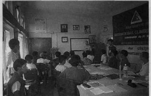
Pouk v predavalnici v Katmanduju

Čas tečaja je določila NMA. Odločili so se za čas pred iztekom monsunskega deževja od 10. septembra do 19. oktobra. O času tečaja se vedno znova pogovarjamo in dogovarjamo. Idealnega termina praktično skoraj ni možno izbrati zaradi zaposlenosti tečajnikov in tudi inštruktorjev. To bi bil čas pred deževjem ali po njem, ko je vreme v gorah lepo. Tako je tudi lani na izvedbo programa vplivalo vreme, zlasti v visokih gorah. Za kraj tečaja so po dveh letih spet izbrali Manang, kjer stoji šolska zgradba.