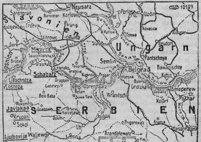
Karte der österreichischen Erfolge in Serbien.