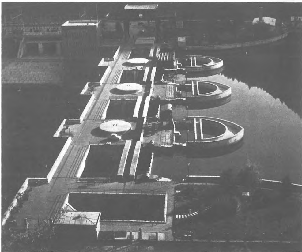
Po 2. svetovni vojno je bila elektrifikacija ena od političnih akcij pod geslom "elektriko v vsako vas". Tako je Dravi bila zgrajena vrsta hidroelektrarn, med njimi tudi Vuhred.

Velika pričakovanja, ki so jih v slovenskem političnem vrhu gojili ob prehodu na novo gospodarsko politiko, se niso izpolnila. Do leta 1957 so se pomnožili in okrepili nekateri činitelji, ki so bili nosilci gospodarske nestabilnosti (notranji trg se ni umiril, splošna in osebna poraba se nista zmanjšali, kot se tudi ni zunanji dolg, ni se dvignila življenjska raven, prizadevanja za izpopolnitev gospodarskega sistema so ostala na pol poti). Tudi predčasno zaključitev druge petletke so v naši republici sprejeli s pesimističnimi občutki, saj se vrsti pomembnih ciljev niso niti približali (premajhen izvoz in delovna storilnost, veliko prekoračenje investicijske porabe). Poleg tega pa je takrat prišlo do "nezdravih pojavov", kot so bile prekinitve dela in povečanje gospodarskega kriminala.