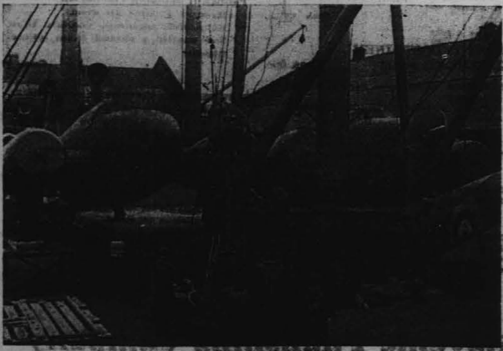
Prizor v nekem angleškem pristanišču, kjer skladajo s parni lka ameriške bombnike, katere je srečno pripeljal čez Atlantik.