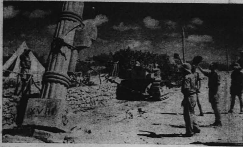
Angleški vojaki, ki so zavzeli Kismajo v italjanski Somaliji, so odpeljali spomenik, ki je bil postavljen Mussoliniju na čast.